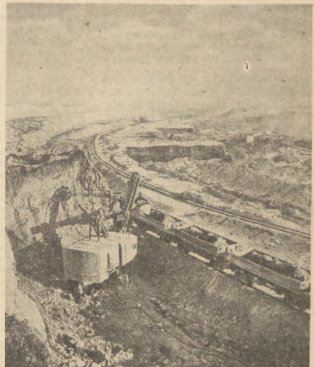
Ogólny widok na plac pod budowę Kujbyszewskiej Elektrowni