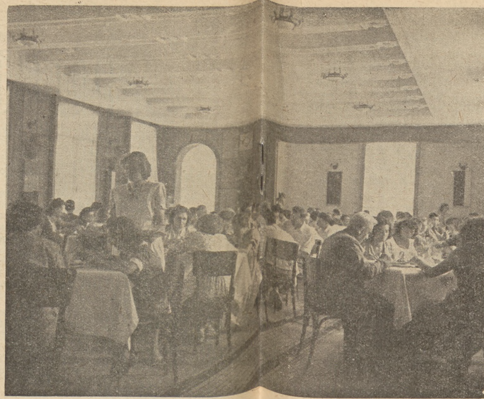
Обед в столовой