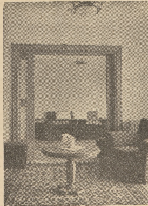
Одна из комнат дома отдыха