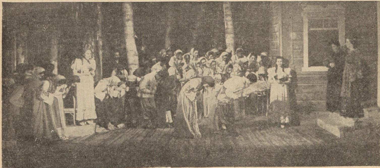
Сцена из оперы «Евгений Онегин» в постановке оперного театра гор. Сталин