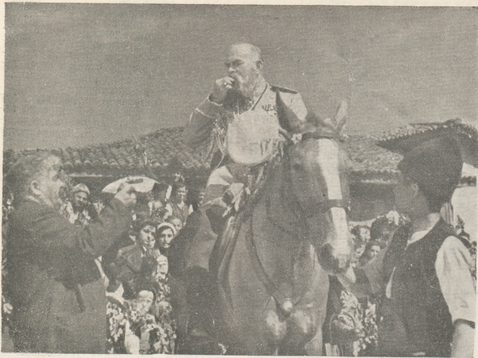
Встреча освободительных русских войск.