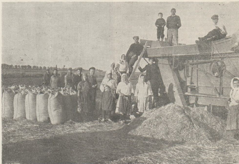
Молодьба богатого урожая риса закончена. Полученные результаты радуют работников Видинского государственного земледельческого хозяйства.