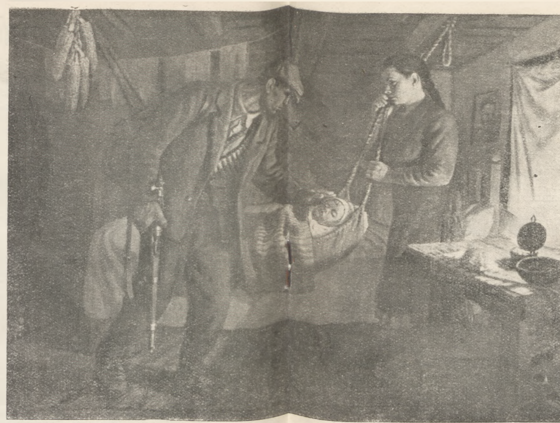
С. Венев. ПРОЩАНИЕ.

Благодаря заботе партии и правительства и освоению советского опыта, болгарские художники и скульпторы уже добились значительных успехов в создании произведений, понятных широким