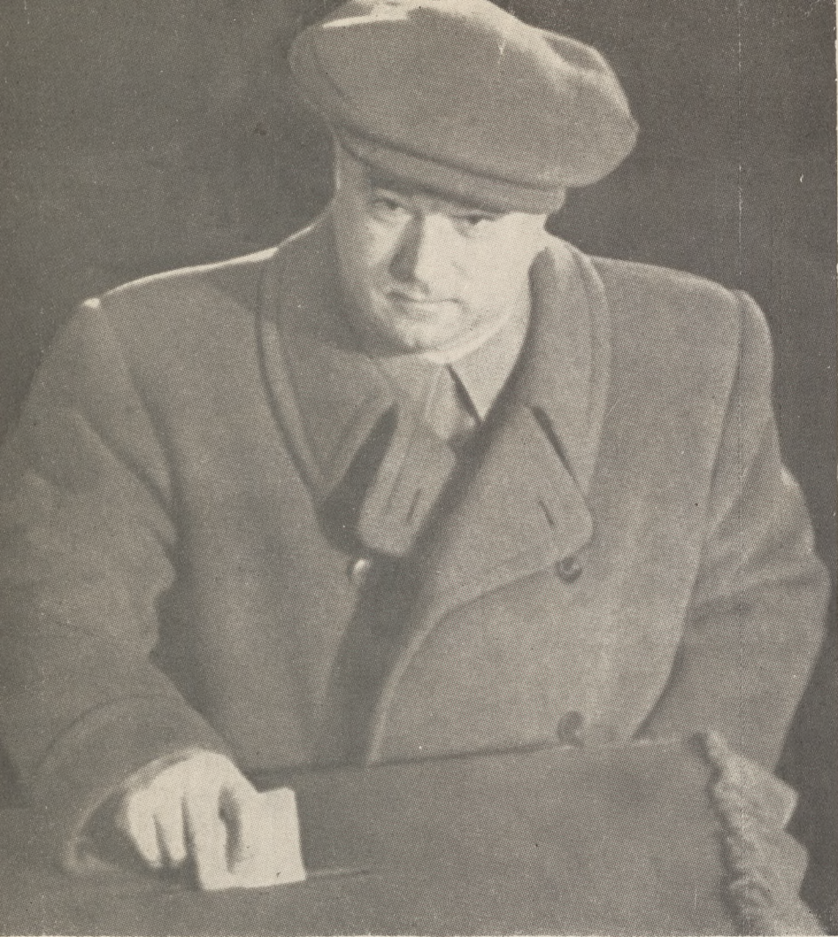
Товарищ Вилко Червенков голосует в зале 28-го избира- тельного участка Сталинского района Софии.