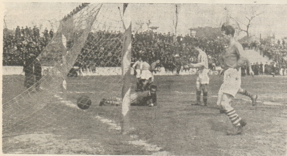
Нападающие ЦДНА прорвались к воротам пловдивской команды Дома народной армии. Еще один гол!