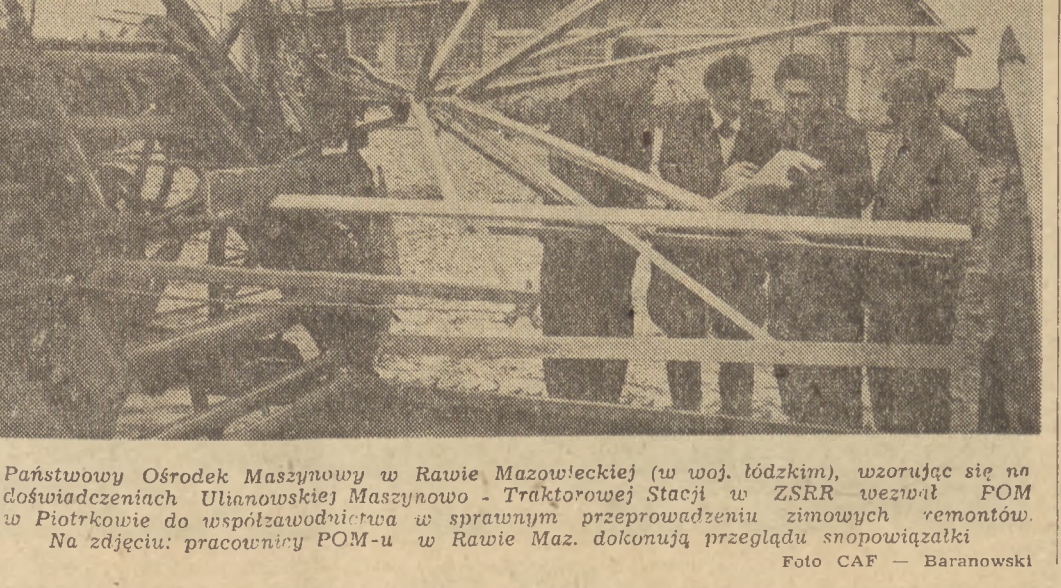
Zimowe remonty maszyn w POM-ach. Państwowy Ośrodek Maszynowy w Rawie Mazowieckiej (w woj. łódzkim), wzorując się na doświadczeniach Ukraińskiej Maszynowni - Traktorowej Stacji w ZSRR wezwali POM w Piotrkowie do współpracy w sprawnym przeprowadzeniu zimowych remontów. Na zdjęciu: pracownicy POM-u w Rawie Maz. dokonują przeglądu osnowiajątki.

Nie jest bynajmniej przypadkiem, że przemysł ten nie może wykazać się osiągnięciami w walce o jakość produkcji. Ze ilości reklamacji Centrali Odzieżowej na przykład w zakładach dzwiewiarskich im. Rycheńskiego dotyczą przeciętnie około 3000 sztuk miesięcznie (C. O. kontroluje tylko pierwsze 5, lub najwyżej 10 sztuk, a więc faktycznie ilość braków jest znacznie większa). Nie jest przypadkiem, że wzrasta ilość re-