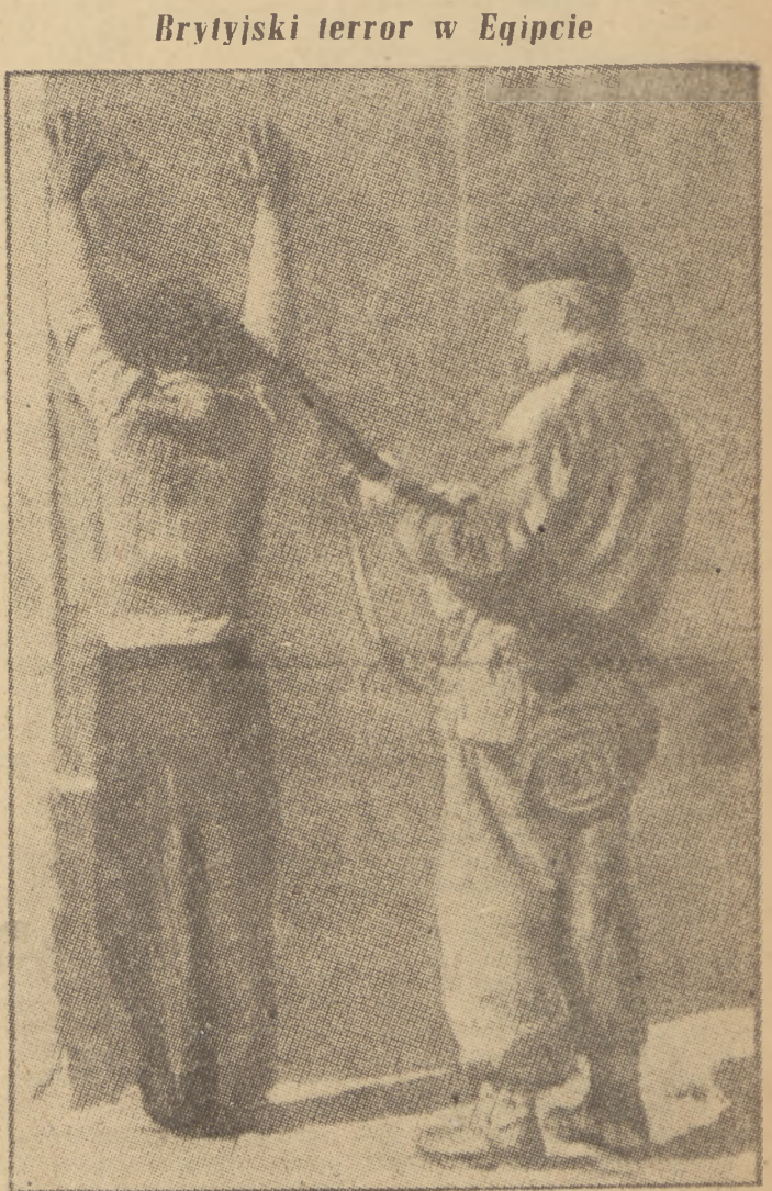
„Rece do góry!” Takie sceny widywaliśmy często na ulicach naszych miast w czasie okupacji hitlerowskiej. Żołdak, który przed chwilą aresztował młodego Egipcjanina nosi mundur brytyjski. Mundury są inne — metody te same

Jego wezwanie, by robotnicy odpowiedzieli na projekt Konstytucji nową falą współzawodniczącej pracy zostało przyjęte huczynnymi oklaskami i okrzykami: „Bierut, Stalin, Pokój!” (b)