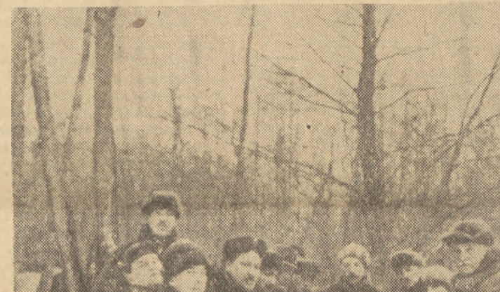
Male, ale dobre towarzystwo