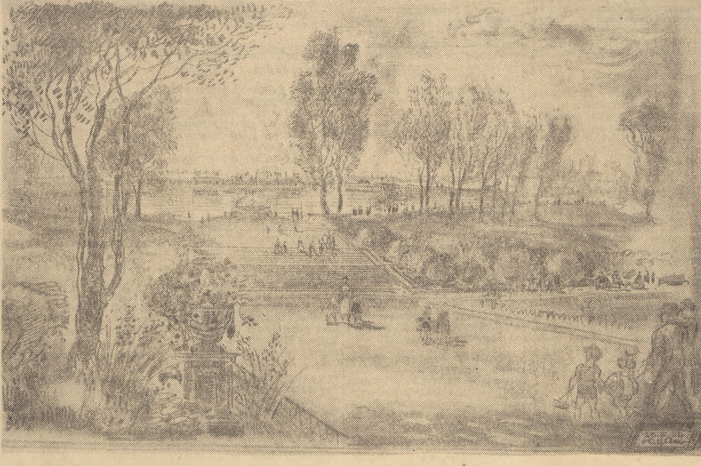
Rysunek przedstawia widok od strony ul. Rozbrat na projektowane schody. Schody te po staną na Skarpie i połączą górne tarasy z osi spacerową prowadzącą od podnóża Skarpy aż do Wisły

W sklepach z odzieżą chcemy widzieć wieszaki informujące nabywców, że punkty poprawek krawieckich uszują w krótkim czasie wszelkie drobne usterki odzieży — ku zadowoleniu klientów.