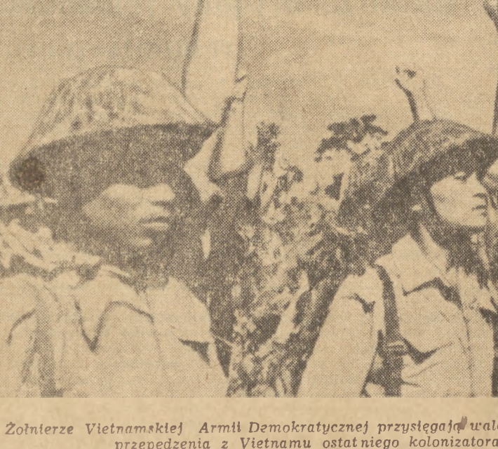
Zobierze Vietnamskiej Armii Demokratycznej przysięgają walczyć aż do zwycięstwa, aż do przepędzenia z Vietnamu ostatniego kolonizatora francuskiego

W sali kina „Hutnik” gromadzą się aktywni i przedownicy prac, bohaterowie powieści i filmu, którzy niejednokrotnie czynnie uczestniczyli w pracach nad nim, goście z fabryki Radomia, Starachowic, Kielc, Skarżyska. Przyszli tu prosto z pracy, od hutniczych pieców, młotów i maszyn. Przy drzwiach tłoczno. Nikt nie chce czekać do jutra, każdy chce obejrzeć ten film dziś.