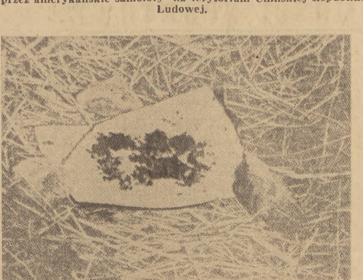
Na zdjęciu: zarażone owady, zrzucone przez samoloty amerykańskie nad terytorium Chin północno-wschodnich.