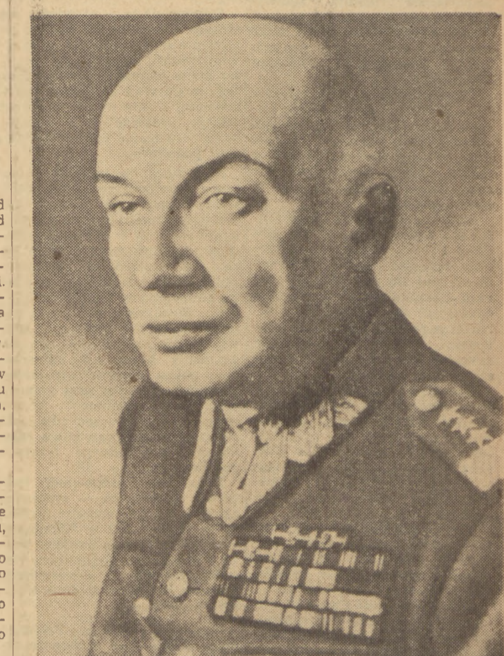
Pięć lat temu zginął od faszystowskiej kuli członek Komitetu Centralnego Polskiej Partii Robotniczej generał Karol Świerczewski-Walter...