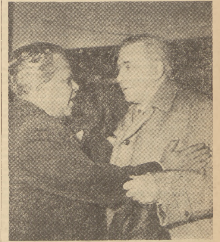
Znakomity pisarz radziecki Ija Erenburg (z prawej) wita się z poetą kubaińskim Nicolosem Guillen. Na str. 2 zamieszczy przemówienie Iji Erenburga, wygłoszone w drugim dniu obrad Kongresu.