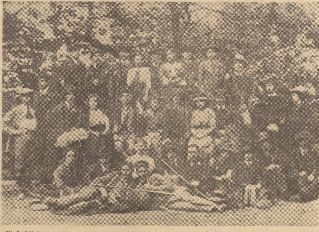
W Lublinie przed pierwszą wojną światową działało postępowe stowarzyszenie „Przyszłość”, którego czynnym członkiem był towarzysz Bolesław Bierut. Stowarzyszenie było legalną placówką wykorzystywaną przez SDKPiU i PPS-Lewicę. Na zdjęciu: członkowie stowarzyszenia „Przyszłość” na wycieczce w Puławach. W pierwszym rzędzie siedzących piąty od prawej towarzysze Bolesław Bierut