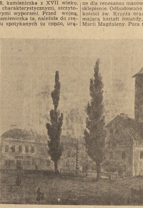
Dawny wygląd ratusza na rynku w Pułtusku

Pułtusk to jedno z najstarszych miast Polski. W historii swojej, która sięga XII wieku, przechodziło ono już wiele okresów rozwoju i upadków, wiele najeżdżów i pożarów — za każdym jednak razem powstawało z ruin na nowo. Przeżyło najeżdż Jądrzyngów, Szwedów i wreszcie obecnie odradza się piękniejszą, z gruzów ostatniej wojny.