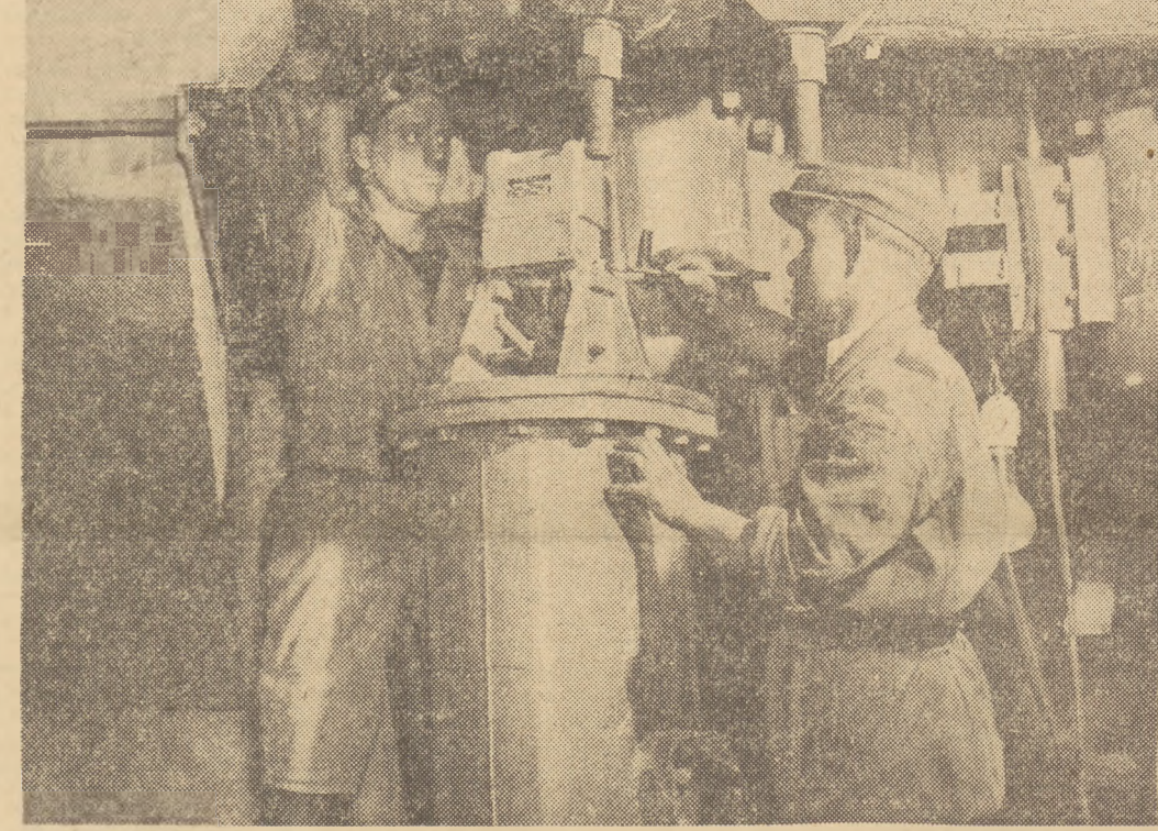
W przededniu 60 rocznicy urodzin towarzysza Bieruta oddana została do ruchu próbno wielka turbina w elektrowni „Miechowice”...