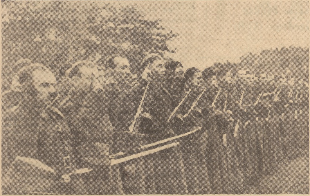
Dziewięć lat temu utworzona została na ziemi radzieckiej z inicjatywy Związku Patriotów Polskich 1 Dywizja im. Tadeusza Kościuszki. W Sielcach nad Oką formować się zaczęły oddziały Kościuszkowców, które w parę miesięcy później wystąpiły u boku Armii Radzieckiej do boju przeciwko hitlerowskiemu najeźdźcy, o wyzwolenie Ojczyzny. Na zdjęciu: oddziały 1 Dywizji składają żołnierską przysięgę