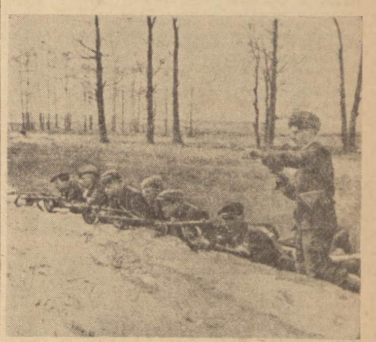
Grupa partyzantów na ćwiczeniach bojowych (Lubelszczyzna — 1944 r.)

Dziesięć lat temu wyruszył pierwszy oddział Gwardii Ludowej — organizacji bojowej PPR do walki zbrojnej z okupantem hitlerowskim o niepodległą Polskę ludu pracującego.