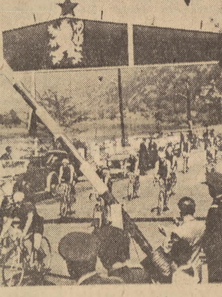
Kolarze Wyciągu Trybuny Ludu, Neues Deutschland i Rudeho Prava w chwili przekraczania granicy polsko-niemieckiej i niemiecko-czechosłowackiej