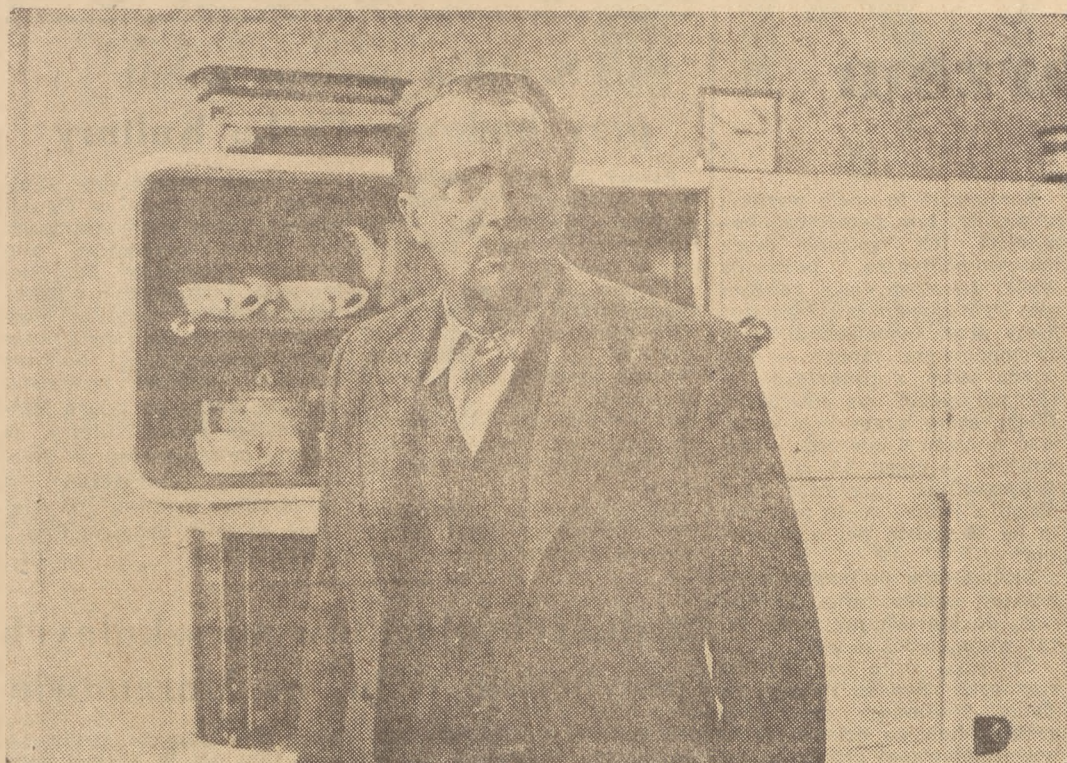
Film „Brygada szlifiera Karhana” — to przeniesienie na ekran znanej w Polsce sztuki Vaszka Kani. Rolę starego Karhana gra znakomity aktor czeski, Franciszek Smolik (na zdjęciu)