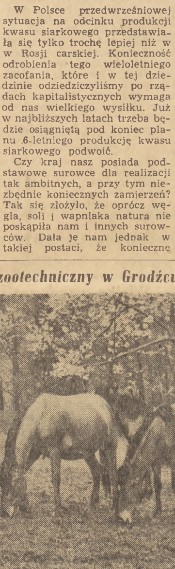
Instytut Zootechniczny w Krakowie posiada w Grodźcu Śląskim doświadczalny majątek, w którym prowadzi się badania nad wyhodowaniem nowych ras zwierząt użytkowych bardziej wydajnych i odpornych na nasze warunki klimatyczne. Na zdjęciu: konie bitgórskie, na którym prowadzi się badania