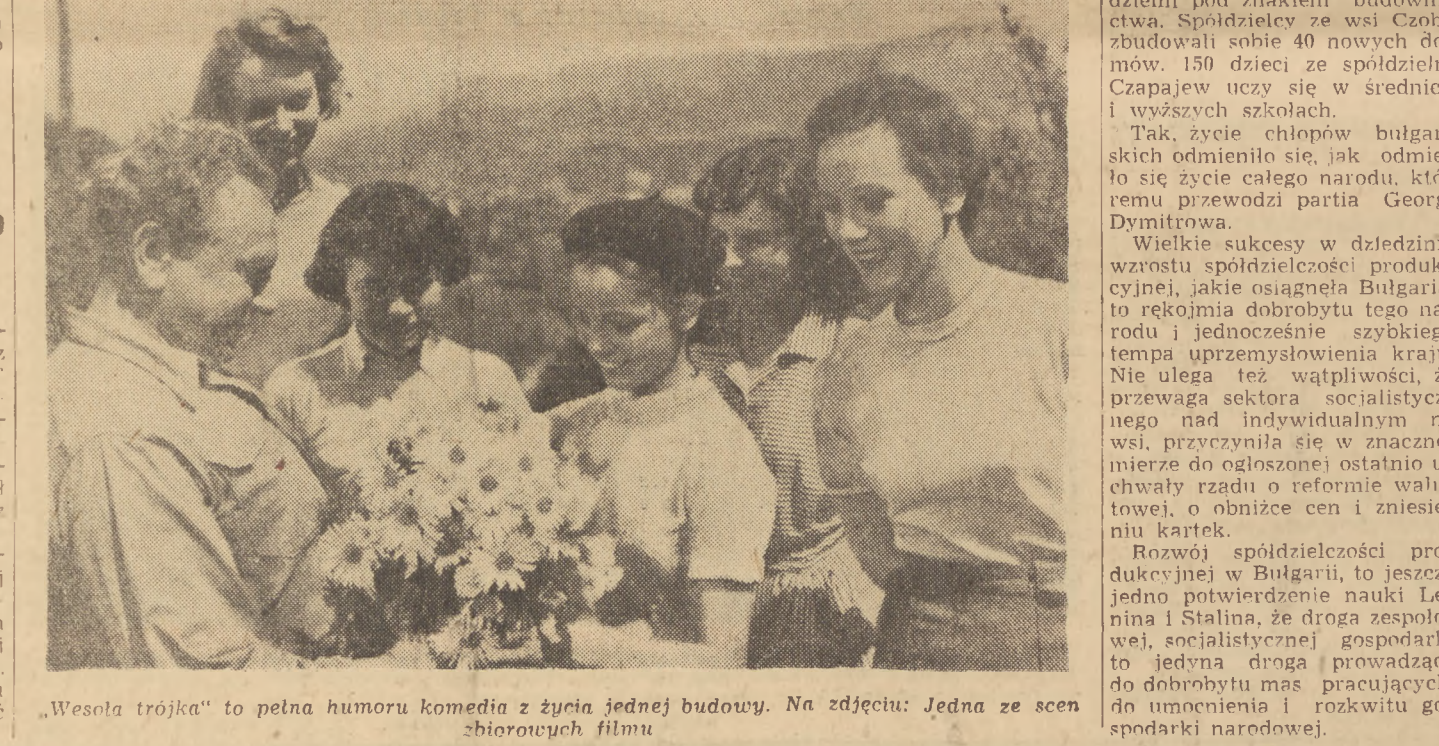
„Wesoła trójka” to pełna humoru komedia z życia jednej budowy. Na zdjęciu: Jedna ze scen z filmu