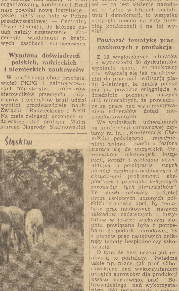
Instytut Zootechniczny w Krakowie posiada w Grodźcu Śląskim doświadczalny majątek, w którym prowadzi się badania nad wyhodowaniem nowych ras zwierząt użytkowych bardziej wydajnych i odpornych na nasze warunki klimatyczne. Na zdjęciu: konie bitgórskie, na którym prowadzi się badania