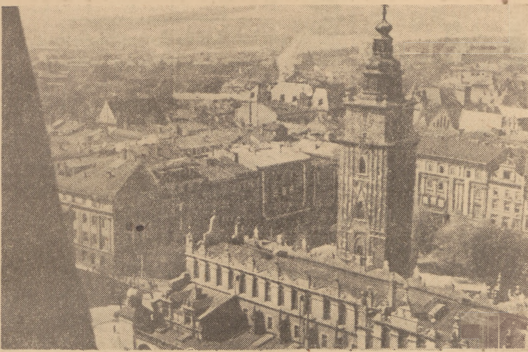
Stary Gdańsk w odbudowie. Na pierwszym planie zrekonstruowana wieża Ratusza Głównego. Miasto ze statką Zygmunta Augusta na szczycie.