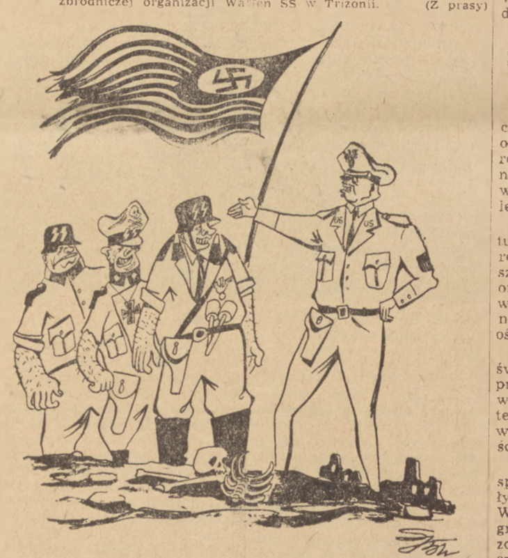
Rys. JAN SOCHACKI

Wyróżnia się na Wybrzeżu świećka przy Zakładach Naprawczych Taboru Kolejowego w Gdańsku. Zespół redakcyjny tej świećki w okresie przedwyborczym wydał 22 gazetki ścienne.