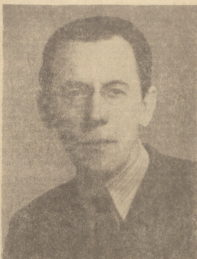
Prof. JAN DEMBOWSKI Marszałek Sejmu