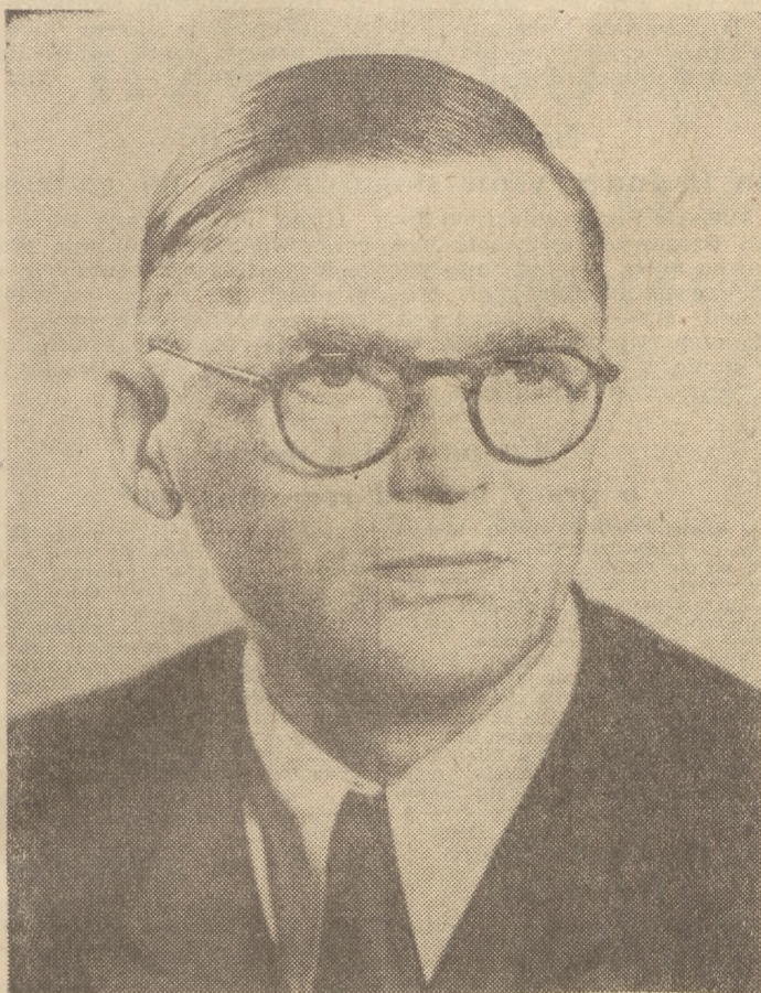
ALEKSANDER ZAWADZKI Przewodniczący Rady Państwa