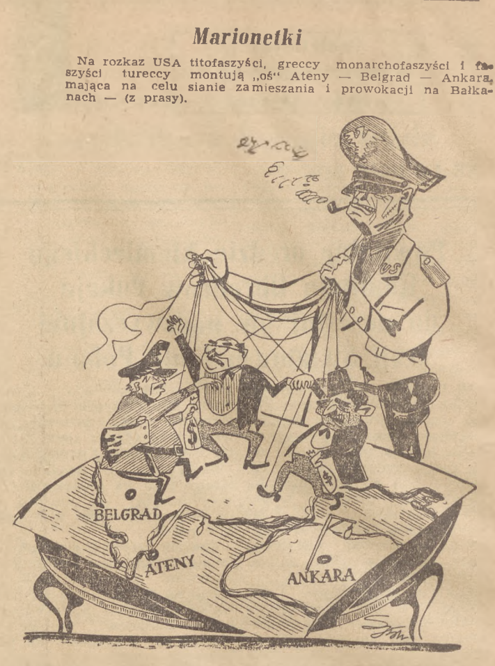
Rys. J. SOCHACKI