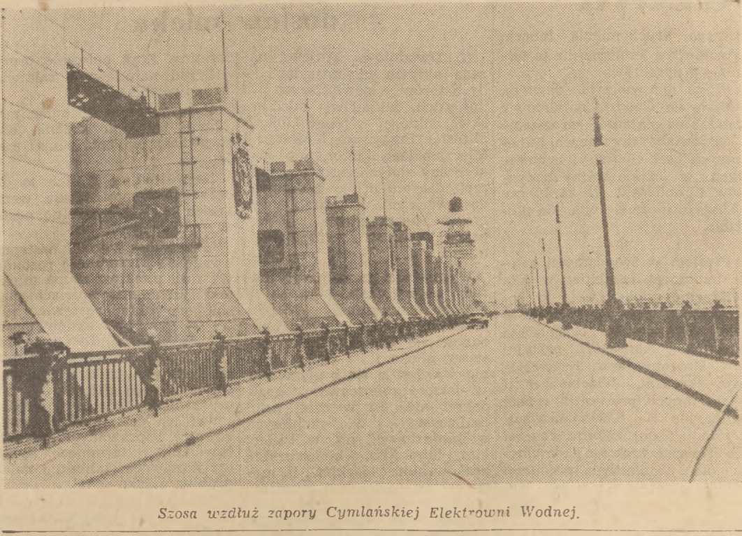
Śsosa wzdłuż zapory Cymlańskiej Elektryczni Wodnej.