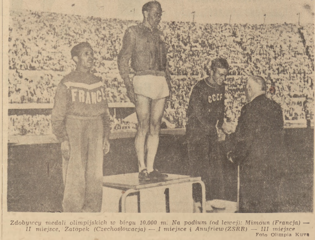
Zdobywcy medali olimpijskich w biegu 10.000 m. Na podium (od lewej): Mimoun (Francja) — II miejsce, Zatopek (Czechosłowacja) — I miejsce i Anufriew (ZSRR) — III miejsce.