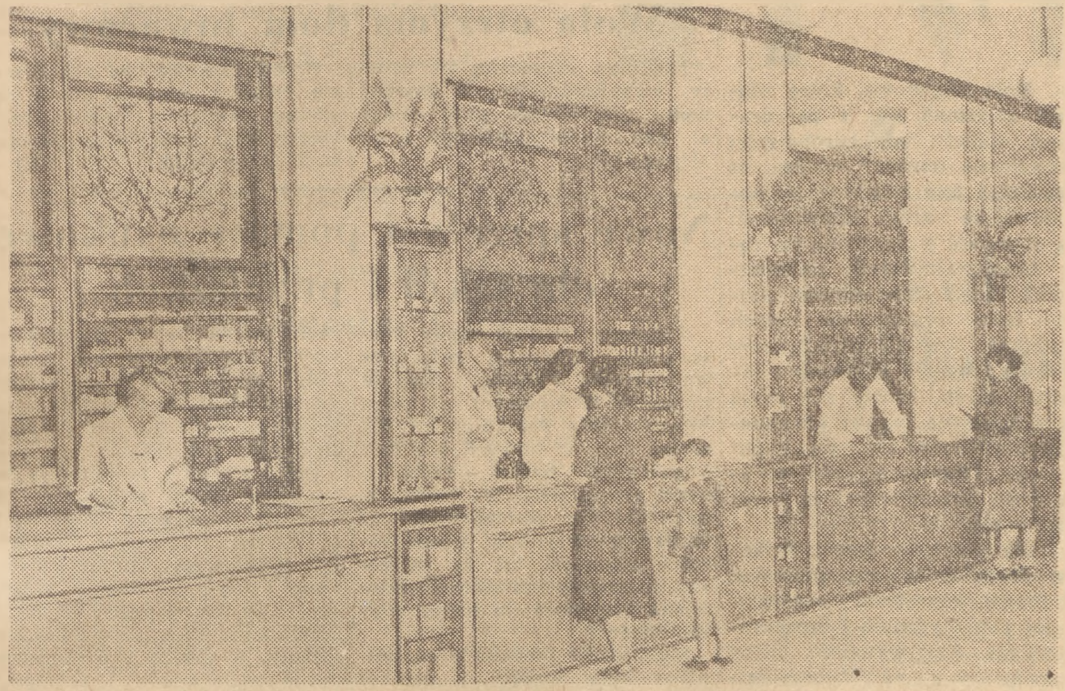
W Warszawie na Muranowie przy ulicy Nowolipie 18 otwarta została wielka apteka, zajmująca całą nowowbudowaną budynek parterowy. Apteka może zapotrząwać o preparaty 30 aptek stołecznych...