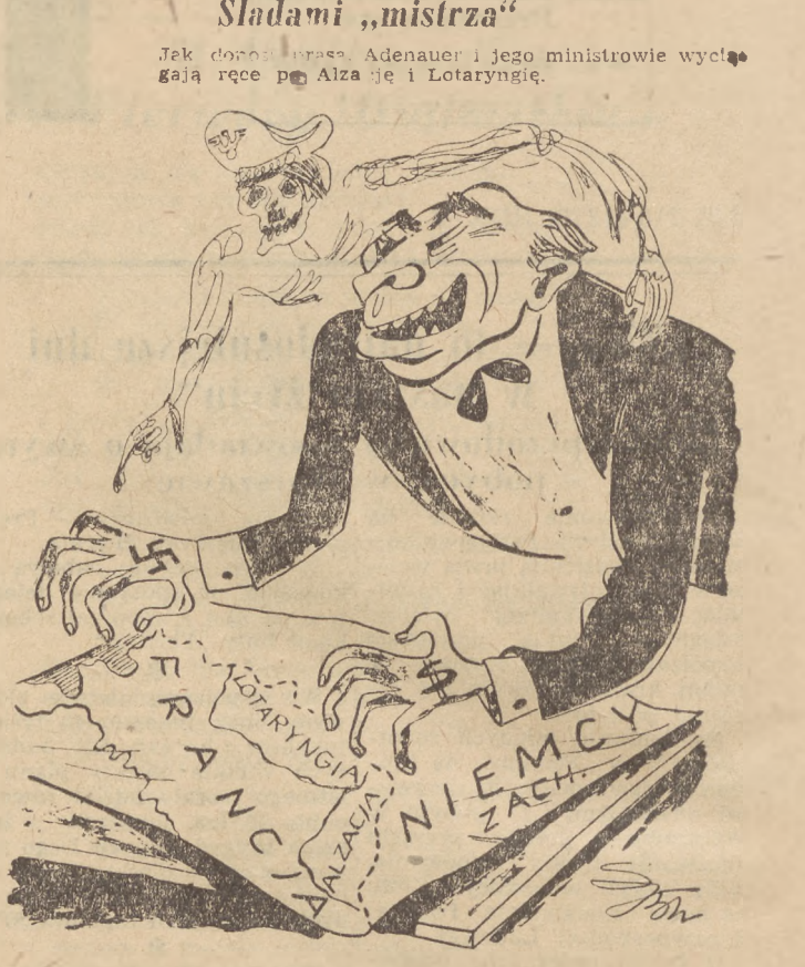
Duch Hitlera: Brauo, ja postępowałem tak samo. Rys. JAN SOCHACKI