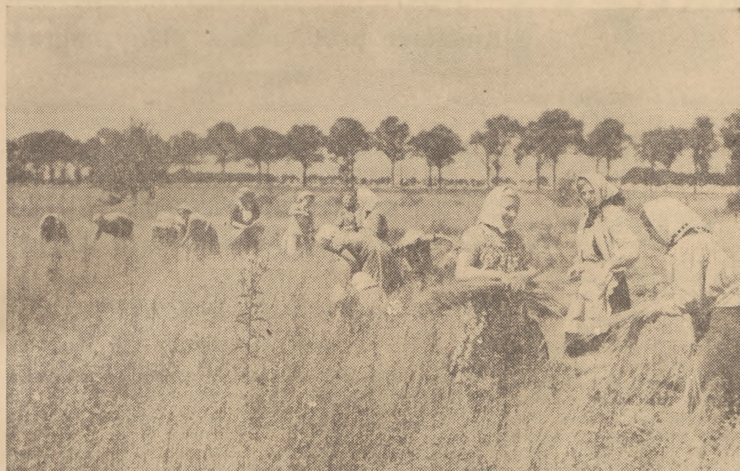
Członkowie spółdzielni produkcyjnej w Mechliniu, pow. Środa, zakontaktowali w br. uprawy lnu. Na zdjęciu: rwanie lnu.