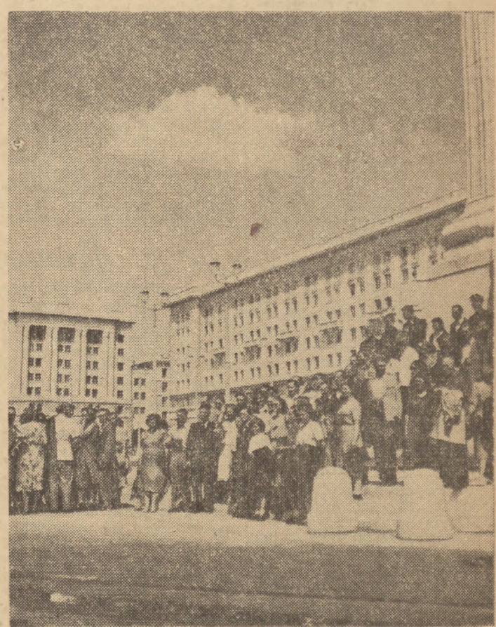
Wycieczka wólkniarzy łódzkich zwiedziła Marszałkowską Dzielnicę Mieszkaniową. Na zdjęciu: Grupa wólkniarzy na Placu Konstytucji.