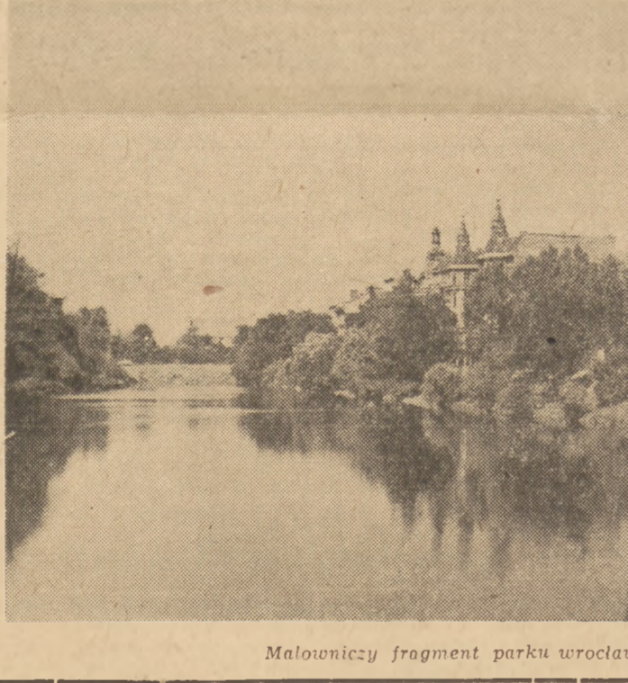
Malowniczy fragment parku wrocławskiego.