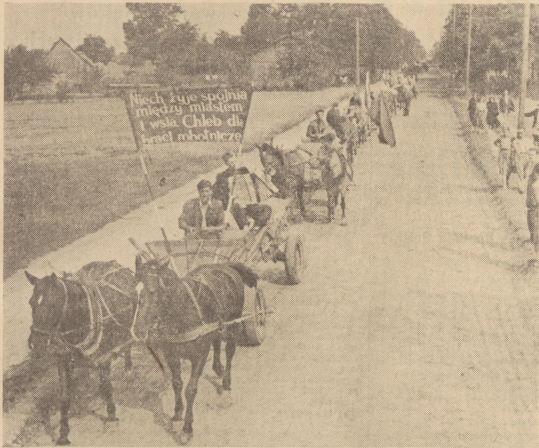
Mało- i średniorolni chłopcy z gromady Tymianka (woj. łódzkie) zorganizowali wspólną, manifestacyjną dostawę zboża. Na zdjęciu: Furmanki w drodze do punktu skupu