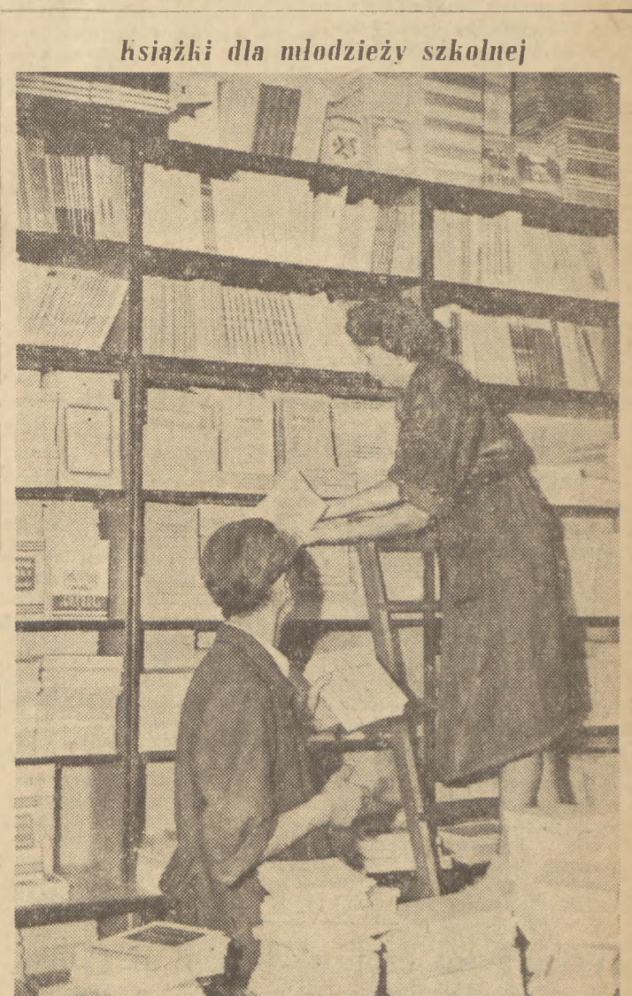
Książki dla młodzieży szkolnej. Zbliża się nowy rok szkolny. Młodzież otrzyma w roku szkolnym 1952/53 25 milionów podręczników. Trudną ostatnie przygotowania, aby wszyscy uczniowie mogli na czas zakupić potrzebne im książki. Na zdjęciu: pracownicy jednej z księgarni układają nowy transport książek.

strony rządu i narodu radzieckiego, — nieustannie przezwycięża rozmaite trudności zarówno wewnątrz kraju, jak i poza jego granicami, i osiągnęła już poważne sukcesy na wszystkich odcinkach budownictwa państwowego. W imieniu przewodniczącego Mao Tse-tunga, w imieniu rządu i narodu chińskiego wyrażam wdzięczność za braterską, bezinteresowną pomoc, jaką okazuje Chińskiej Republice Ludowej rząd radziecki i naród radziecki pod kierownictwem Generalissimusa Stalina. Delegacja rządowa Chińskiej Republiki Ludowej przybyła do Moskwy w celu dalszego umocnienia przyjaźni i współpracy między obu krajami i omówienia różnych związanych z tym problemów. Jestem głęboko przekonany, że dalszy rozwój przyjaźni i współpracy dwóch wielkich państw — Chińskiej Republiki Ludowej i Związku Socjalistycznych Republik Radzieckich, niezawodnie stanowić będzie jeszcze poważniejszy wkład w dzieło pokojowego budownictwa narodów chińskiego i radzieckiego, a także — w dzieło pokojowego budownictwa wszystkich narodów świata. Niech żyje przyjaźń, sojusz i współpraca między Chińską Republiką Ludową a Związkiem Socjalistycznych Republik Radzieckich! Niech żyje najlepszy przyjaciel narodu chińskiego, wielki nauczyciel mas pracujących całego świata, towarzyszu Stalin!