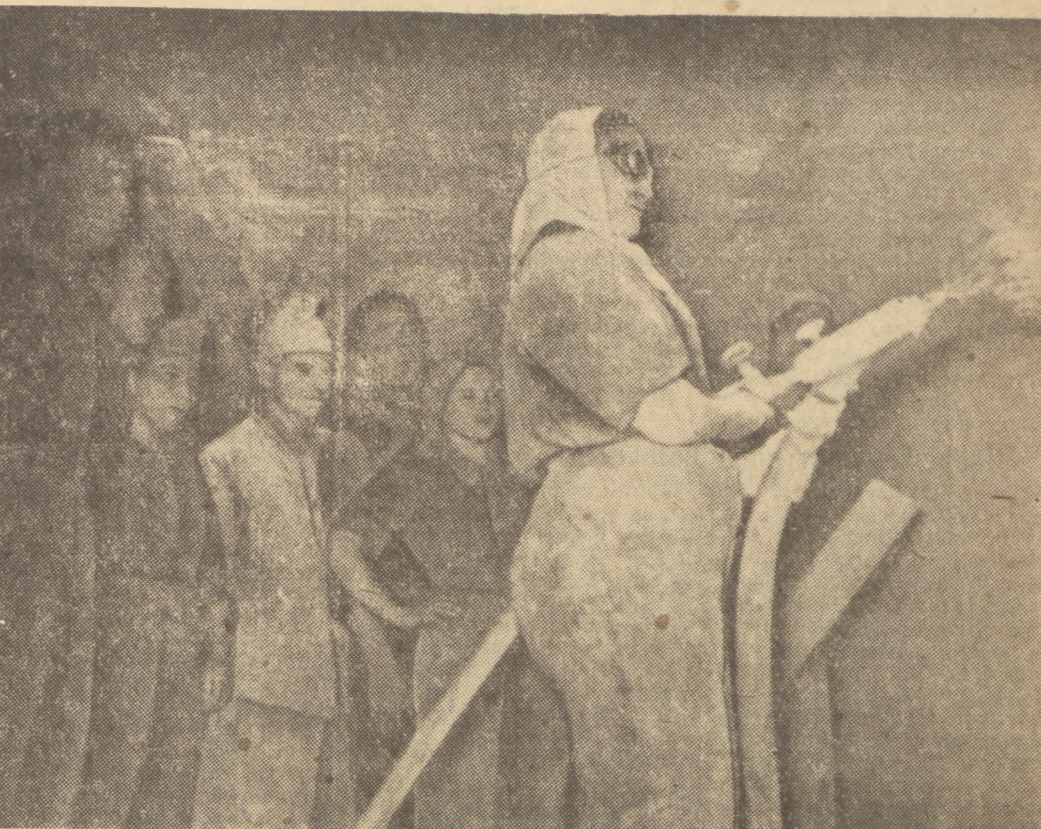
Na budowie Grochowskiej II zorganizowano kurs mechanicznego tynkowania, na którym podnosi swoje kwalifikacje 32 tynkarzy i tynkarek z całej Polski.