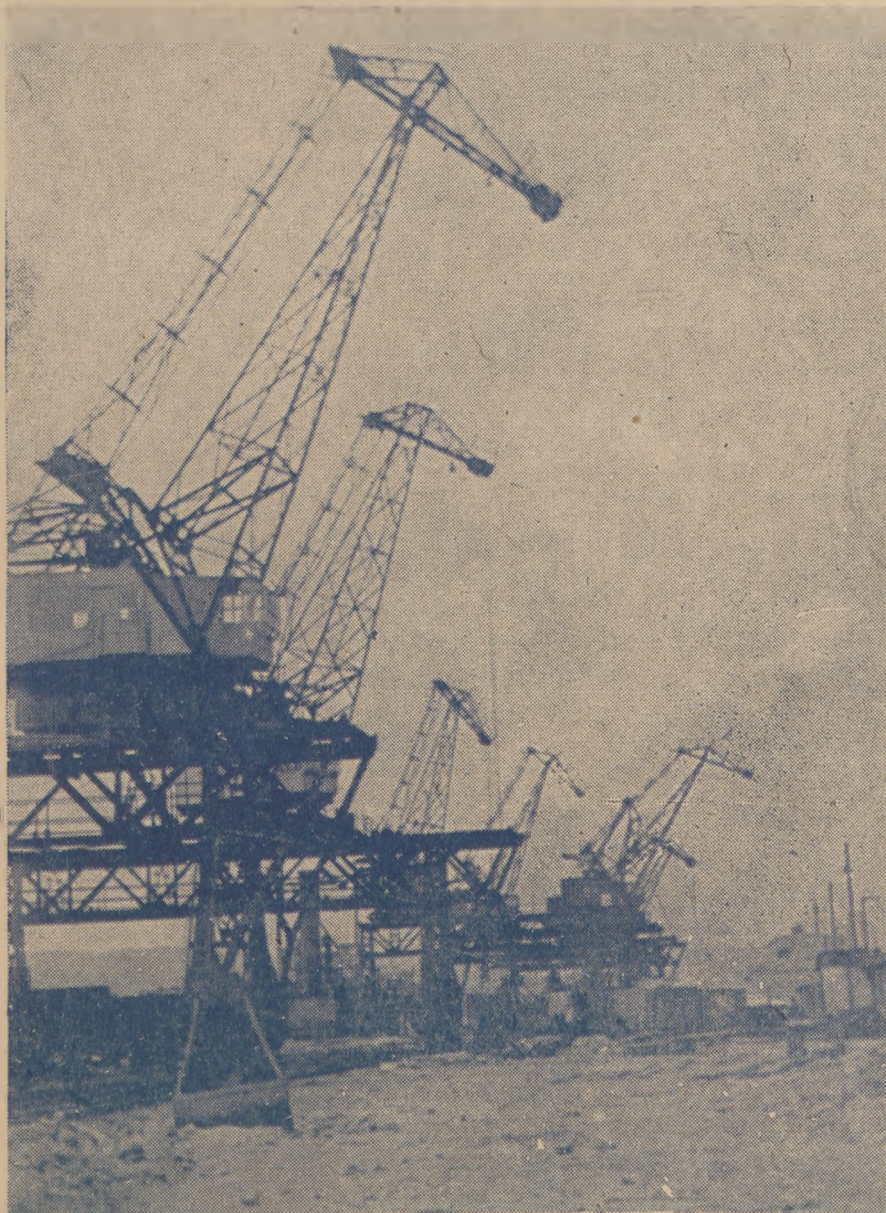
Dźwigi w porcie gdynskim