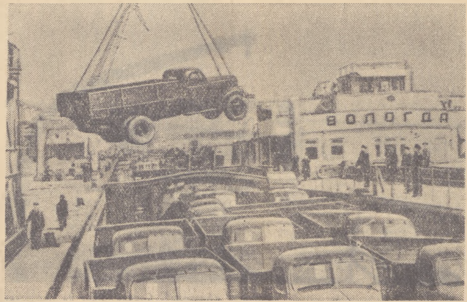
Волжский грузовой теплоход «Вологда» — одним из первых без палубы прошел из Северного порта в Южный. На этот теплоход впервые в практике работы Южного порта портальными кранами грузились автомашины автозавода имени Сталина.

В. СУХАРИН, начальник Судоходной инспекции Волжского бассейна.