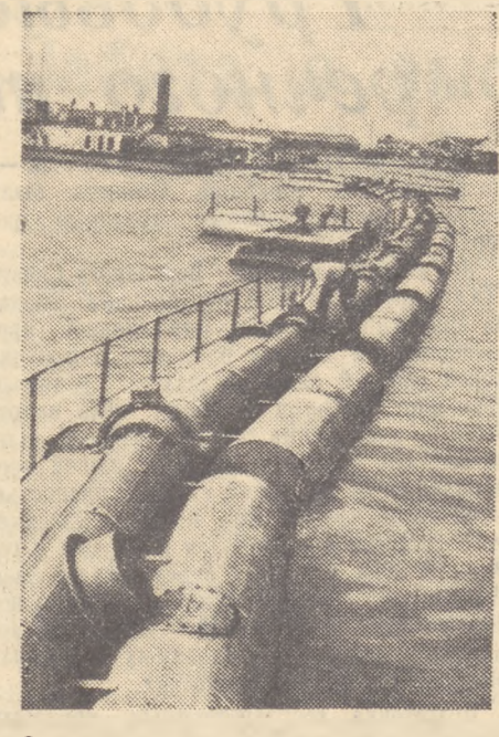
Землечерпалка «Амурская-14» — передовая в Амурском бассейне. Коллектив землечерпалки уже выполнил пятилетний план и с большим подъемом несет стахановскую вахту мира. На снимке: землечерпалка «Амурская-14» углябляет подход к Хабаровскому порту.

И Чайка вместе со своим гарнизонном энтузиазмом берется за верное ему тру-