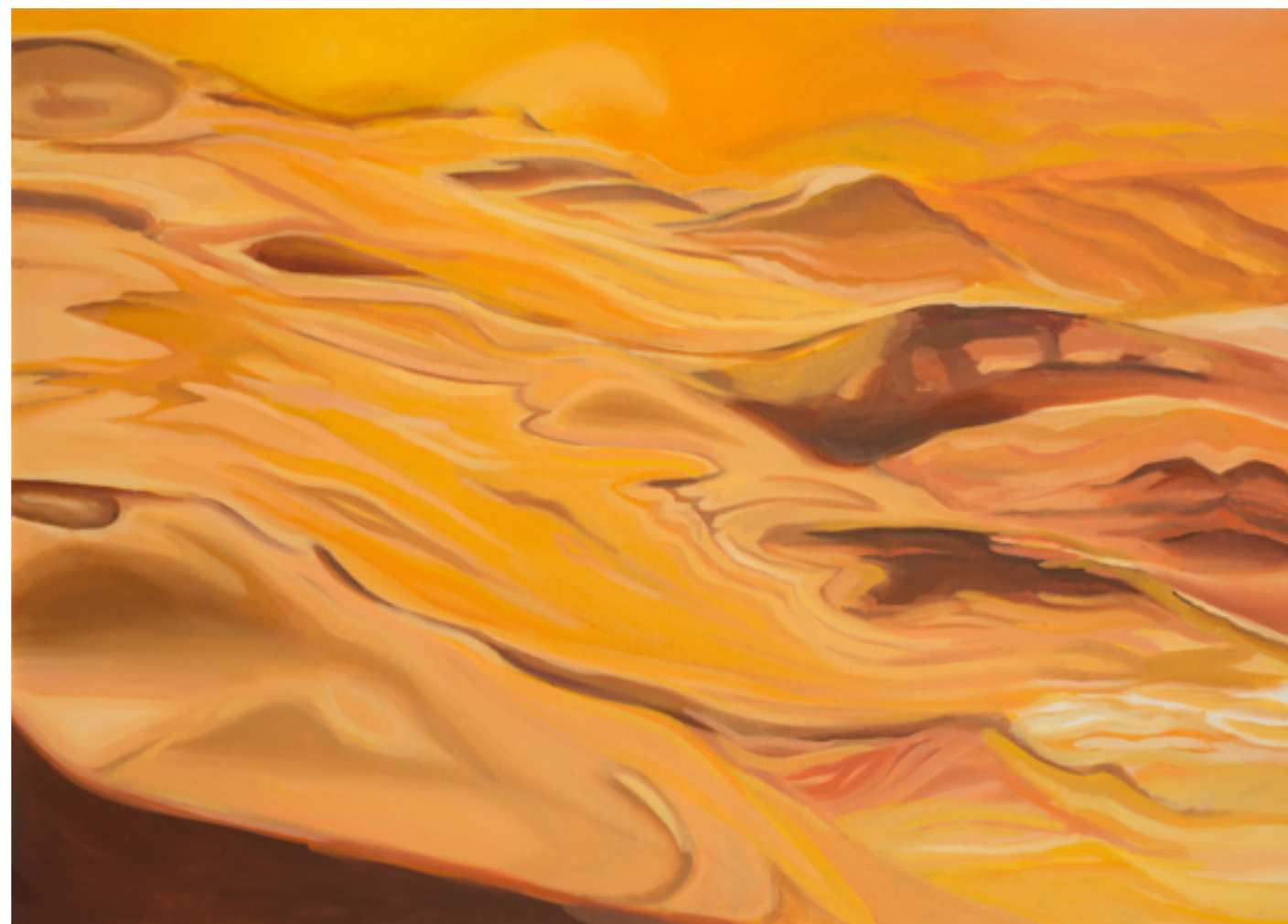
Pustynia Bałtycka olej na płótnie 100 x 160 cm 2021