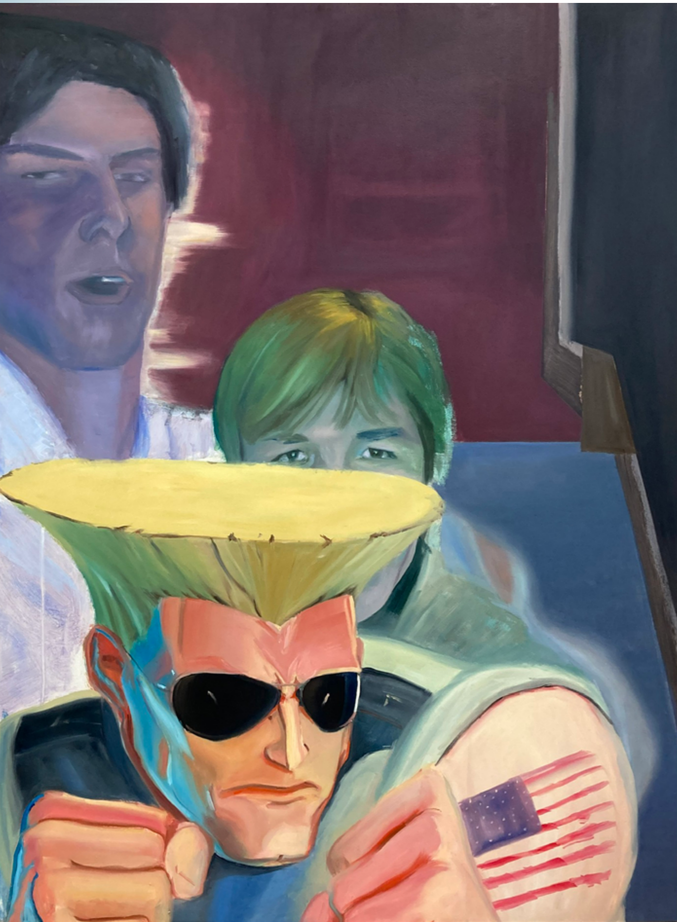
Go home and be a family man akryl i olej na płycie 90 x 130 cm 2021