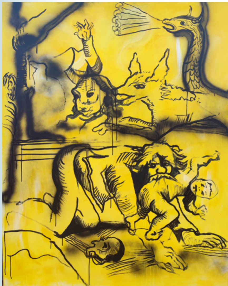
Świat technika mieszana 150 x 130 cm 2021/22