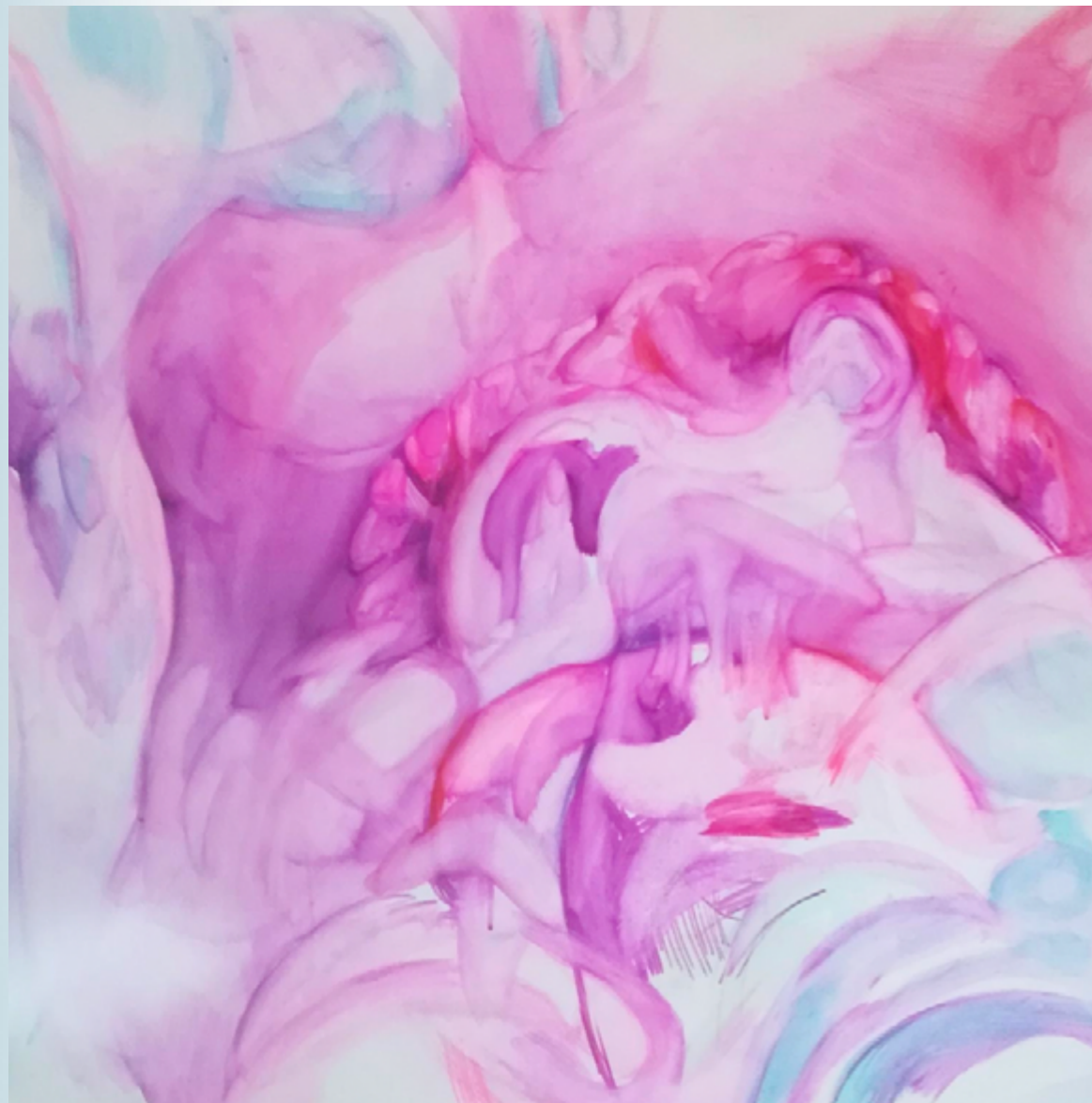
Bokser akryl na płótnie 100 x 100 cm 2022