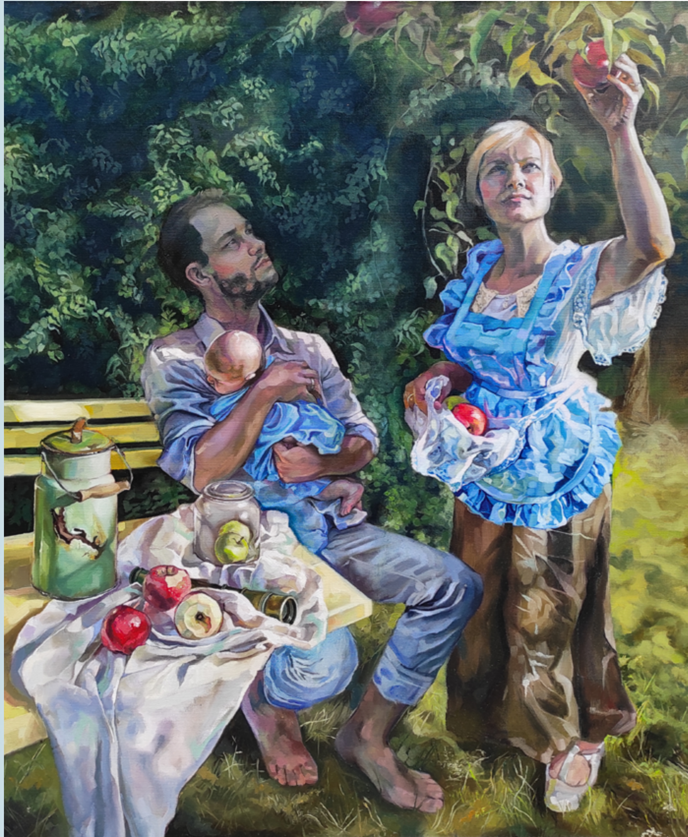
Flauta olej na płótnie 100 x 120 cm 2022