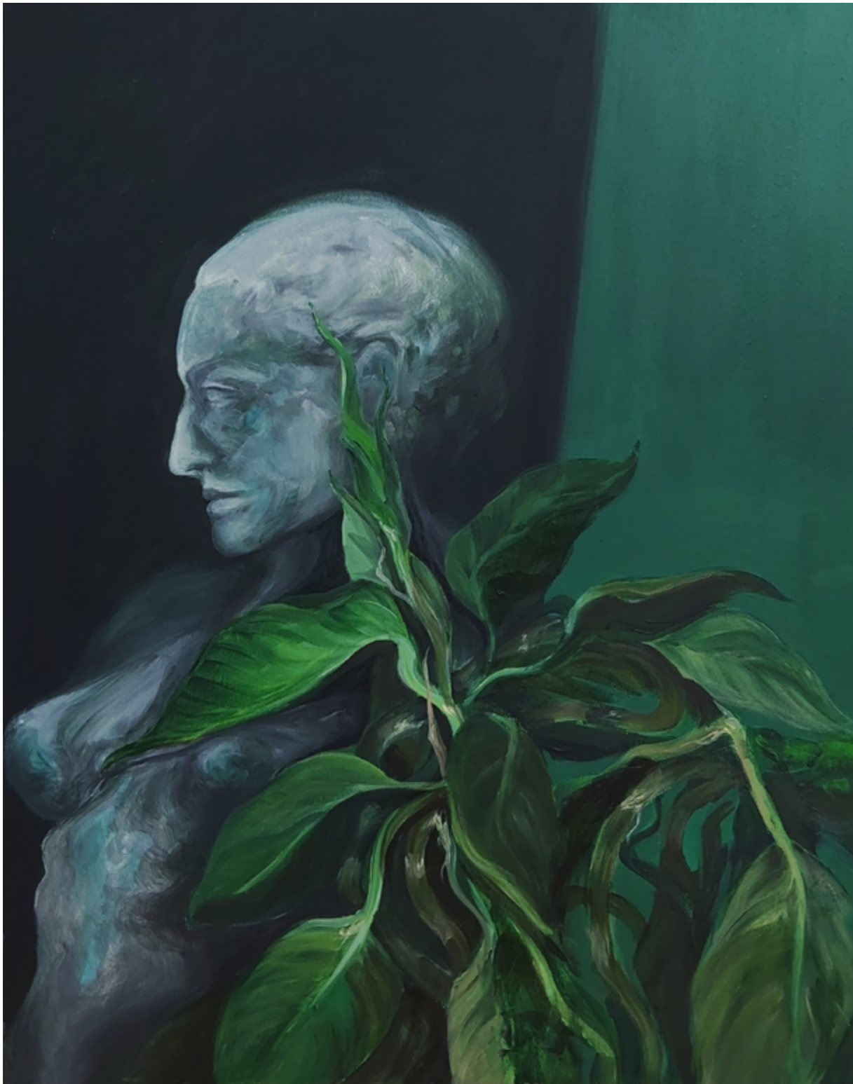
bez tytułu akryl na płótnie 65 x 80 cm 2022