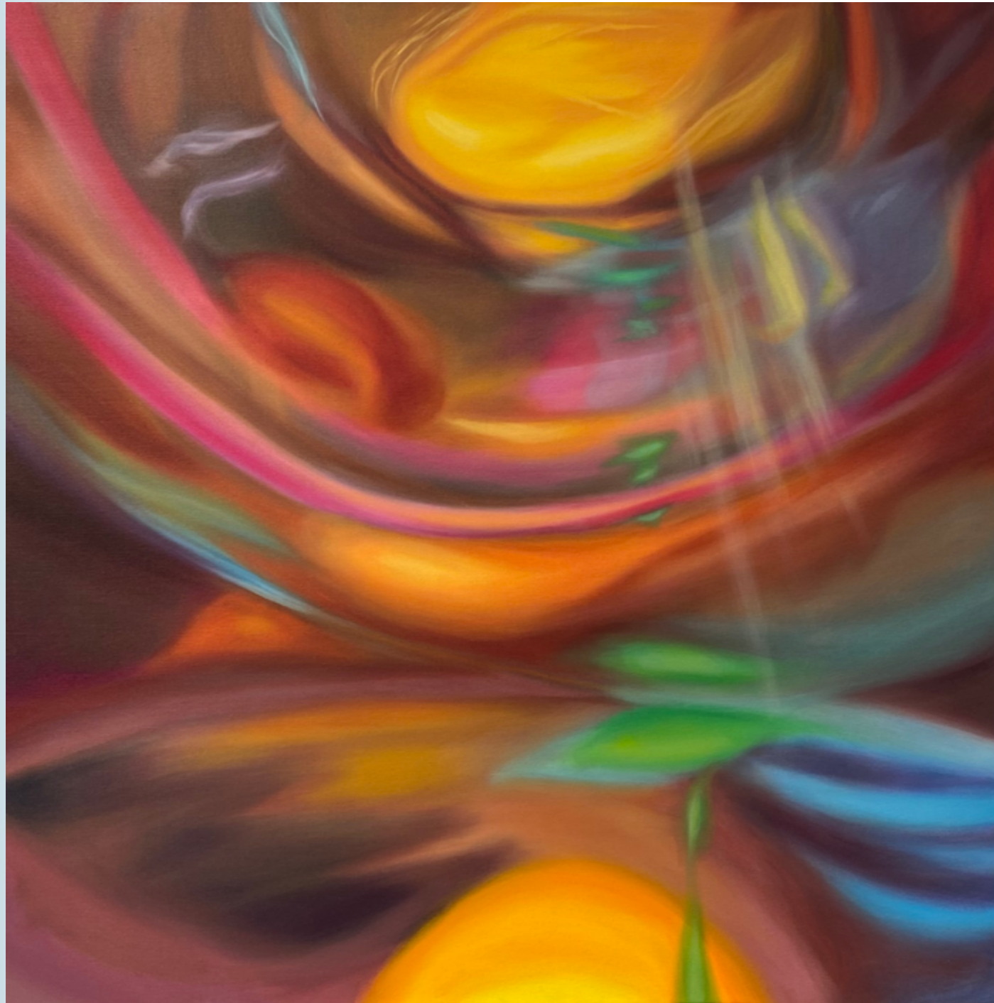
Abstrakcja półkolistka olej na płótnie 100 x 100 cm 2022