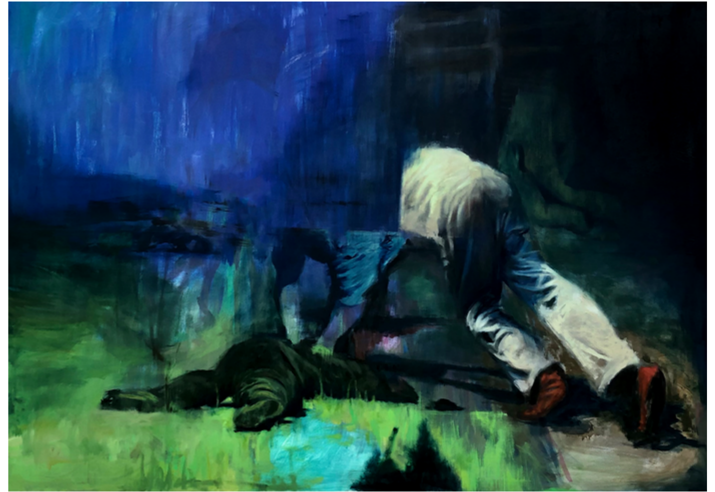
Enemy Territory 007 olej na bawełnie 220 x 160 cm 2022