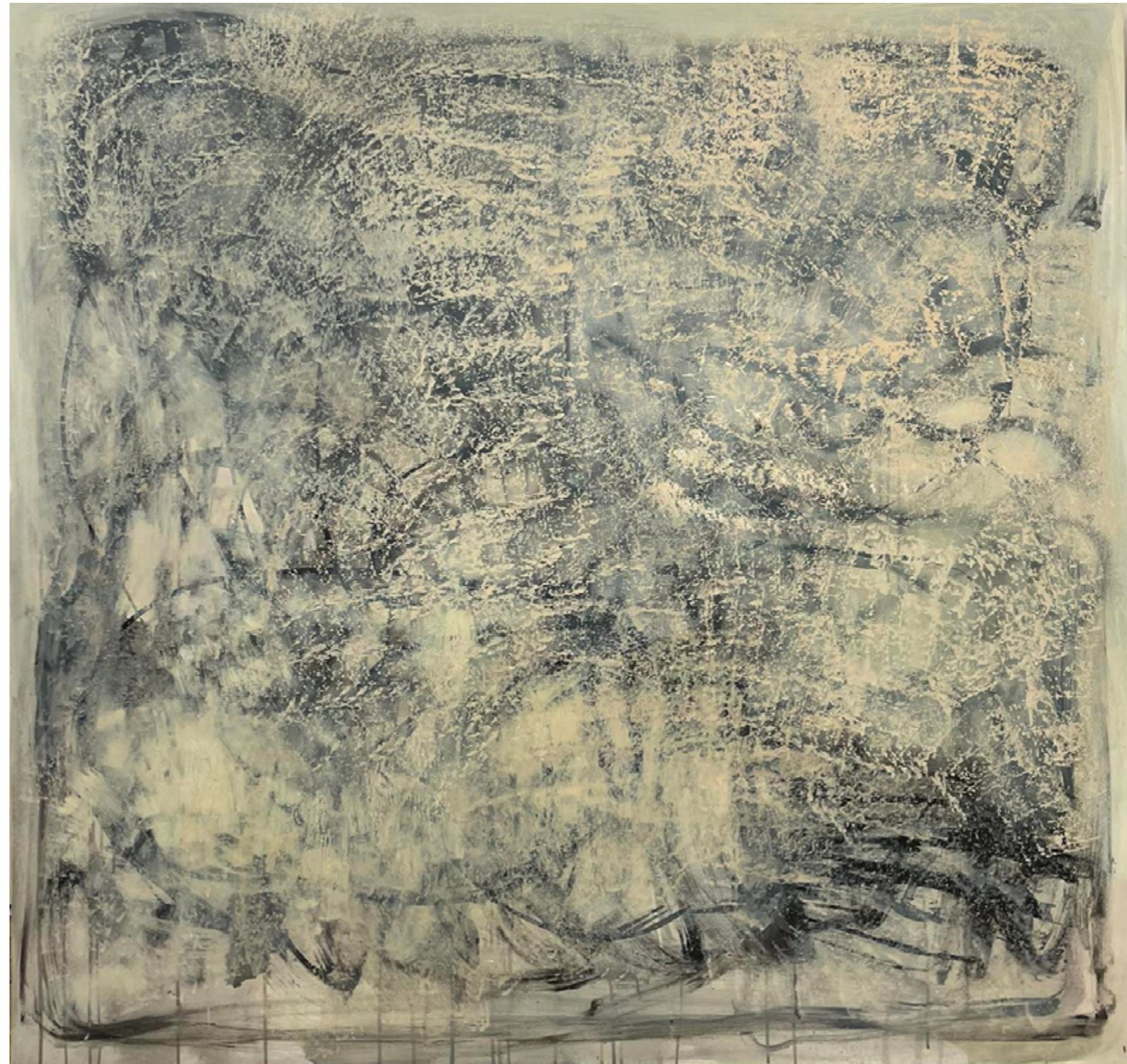
Structures spray, olej, węgiel 150x150 cm 2022