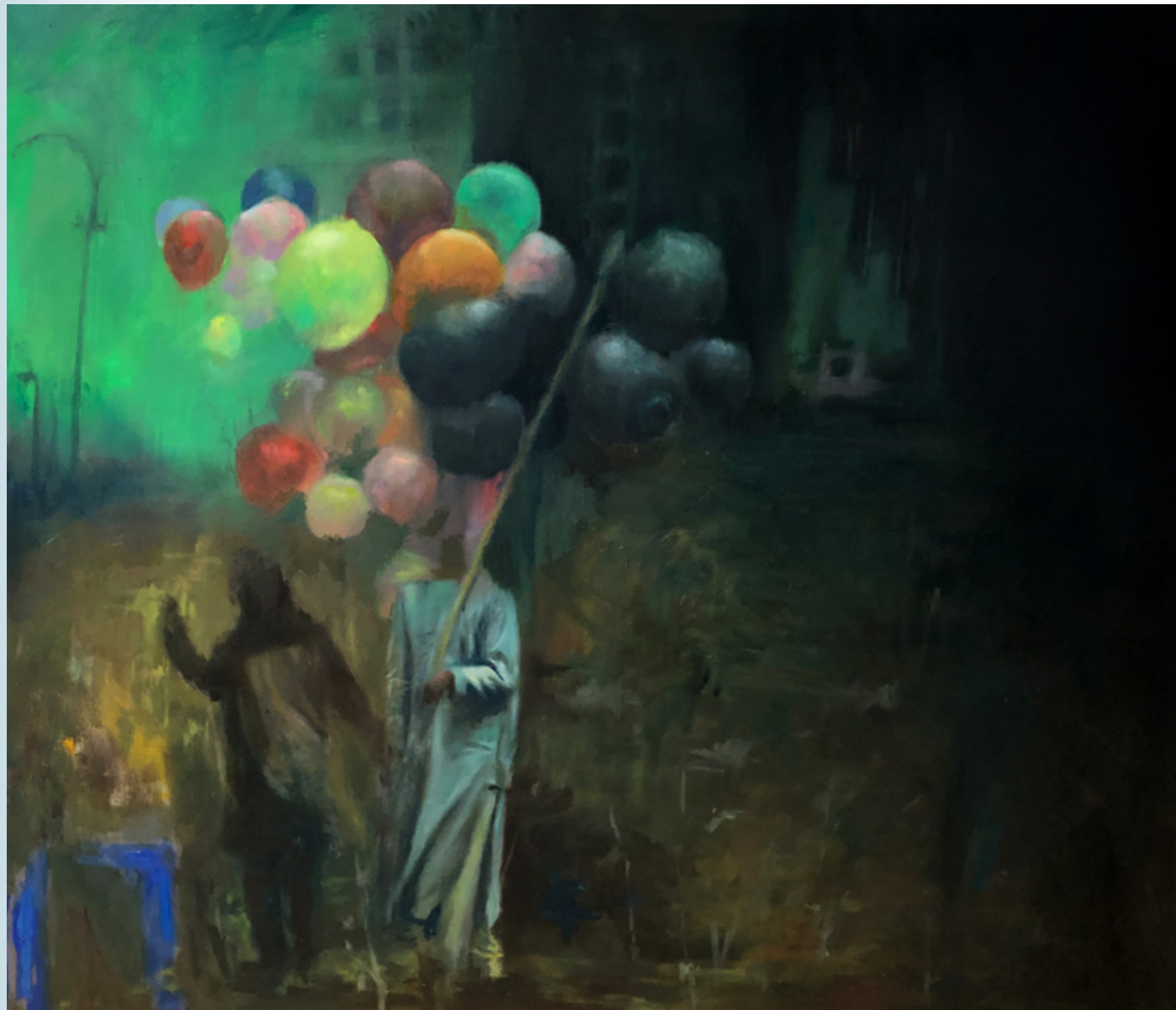
Enemy Territory 008 olej na bawełnie 220 x 160 cm 2022