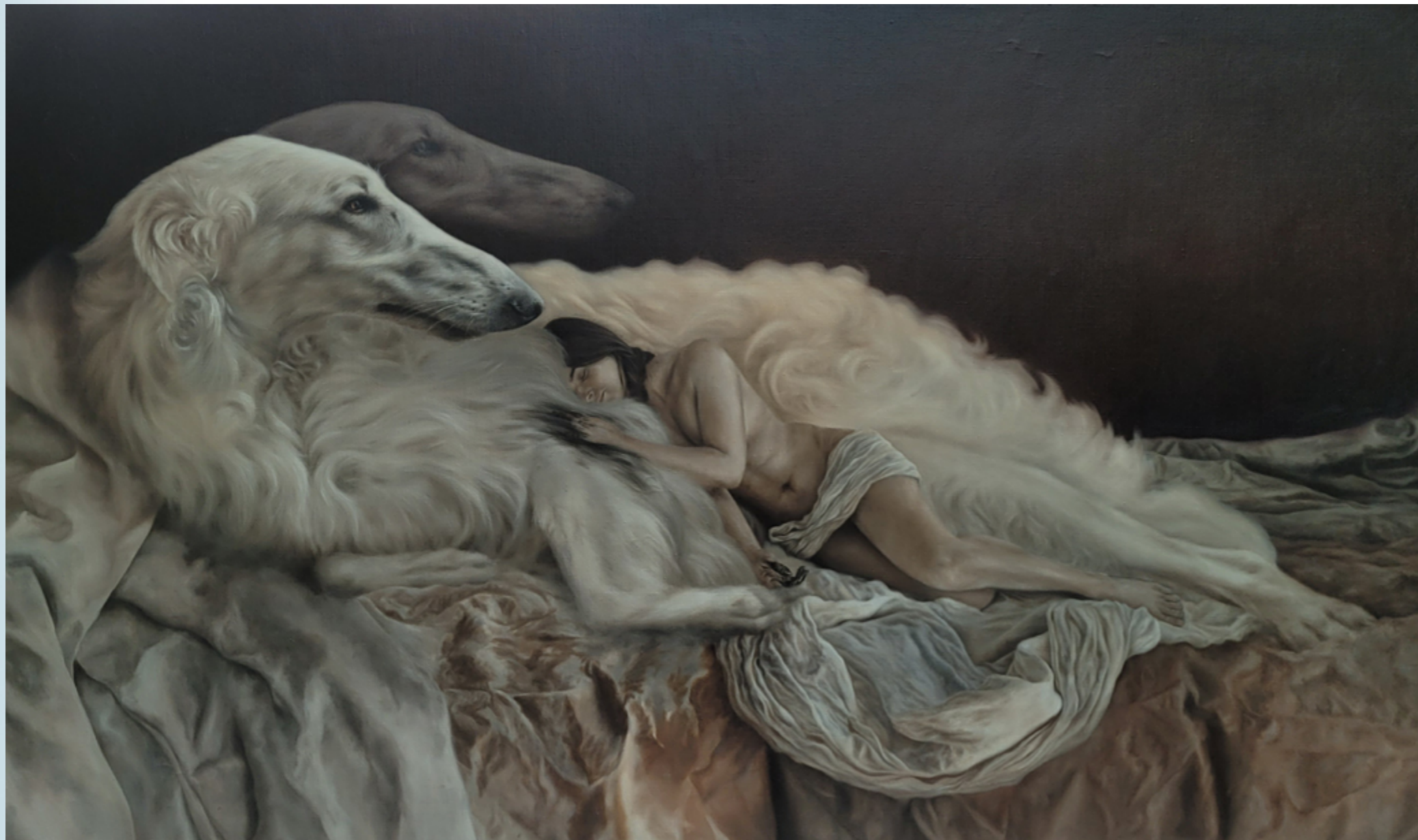
Per venas susurri eius olej na płótnie 100 x 160 cm 2021