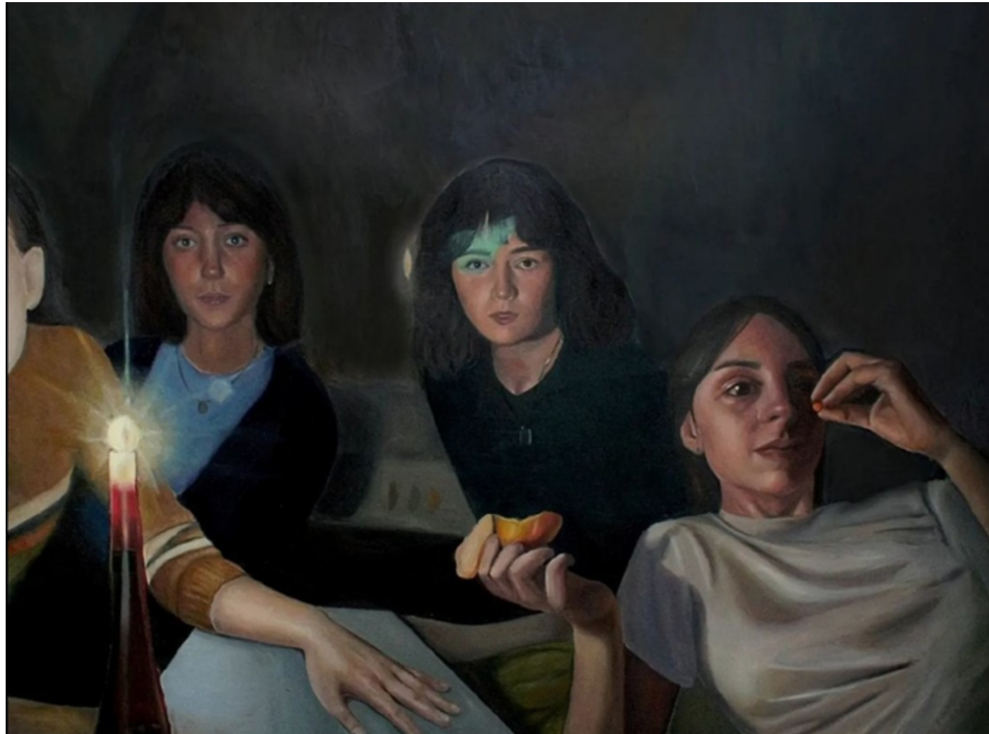
Z ciemności olej na desce 200 × 150 cm 2021