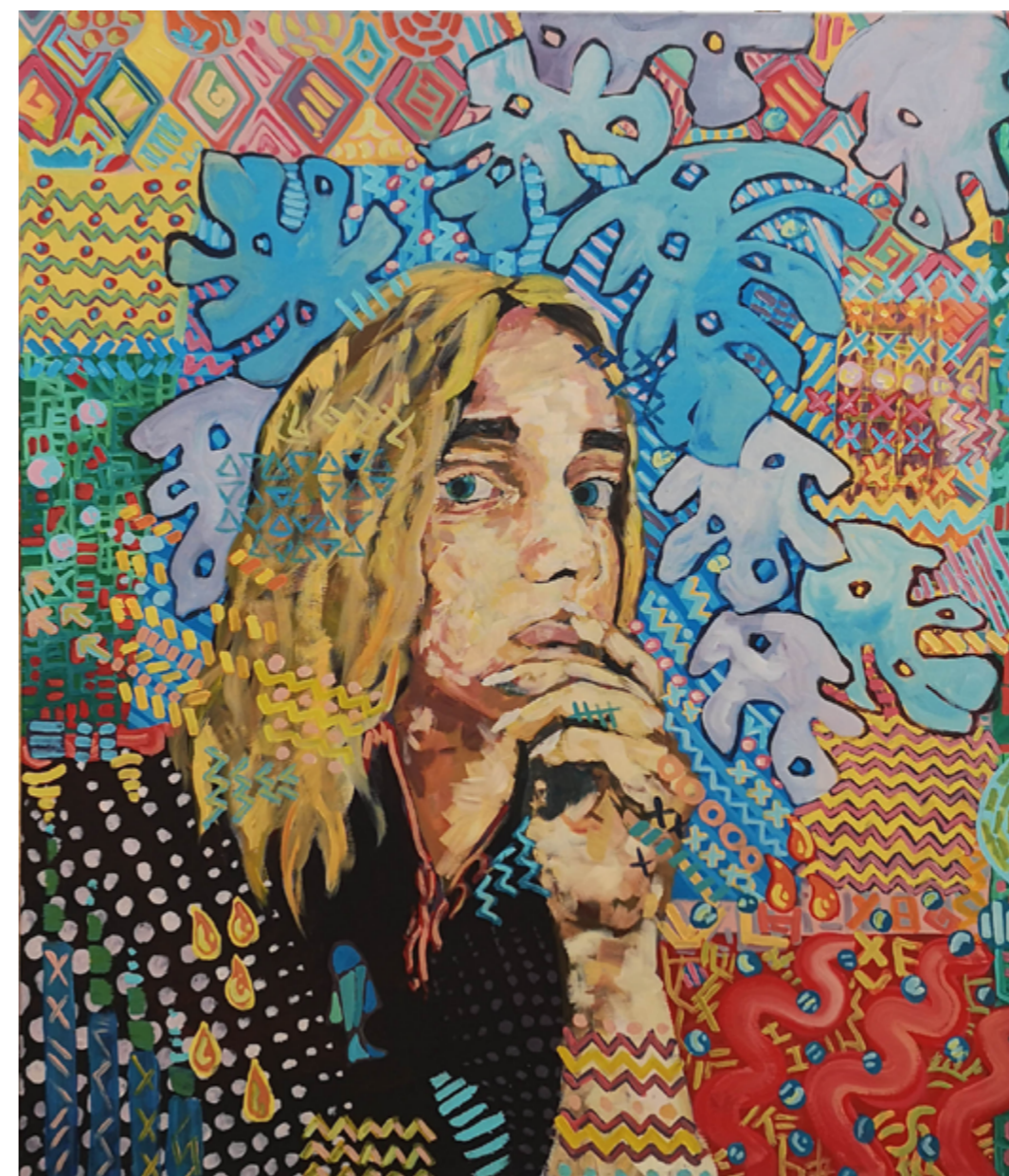
Autoportret akryl na płótnie 120 x 100 cm 2022