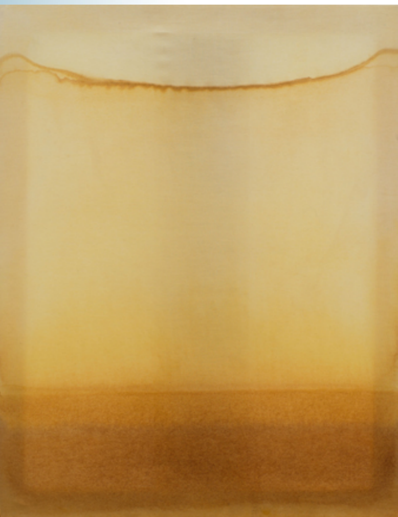
Zanurzenie pigmenty na płótnie 50 x 40 cm 2021