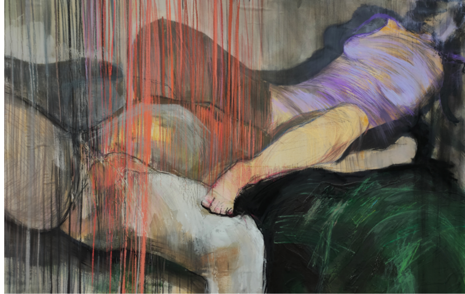
bez tytułu akryl i suche pastele płótno na desce 150 x 100 cm 2022