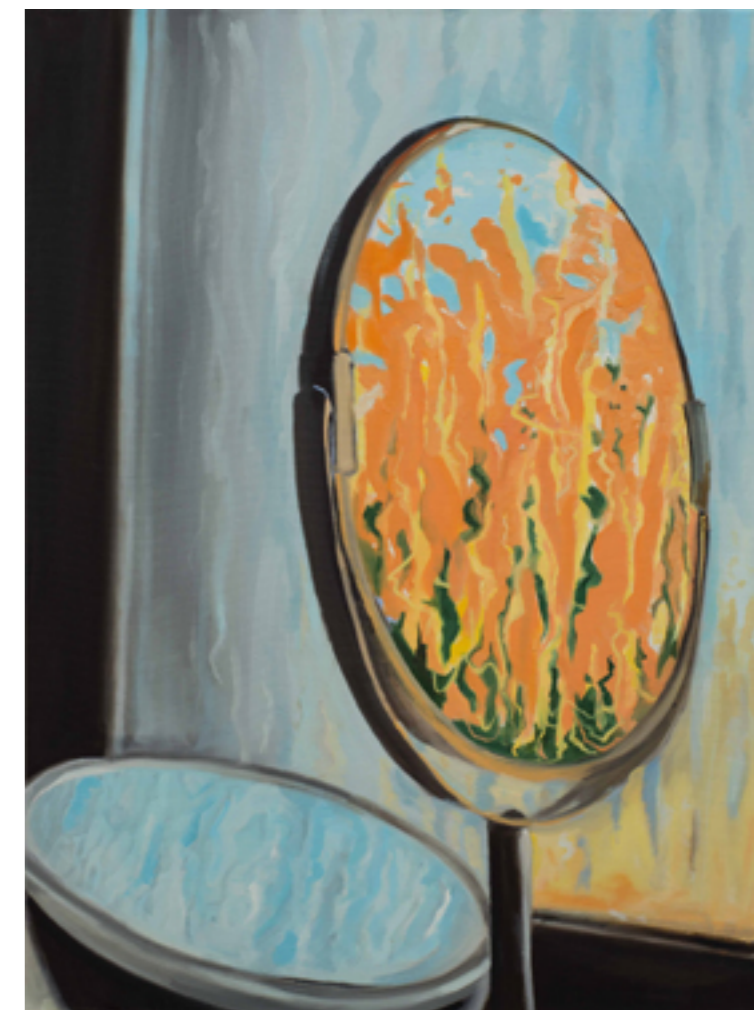
Odbicie olej na płótnie 100 x 70 cm 2021