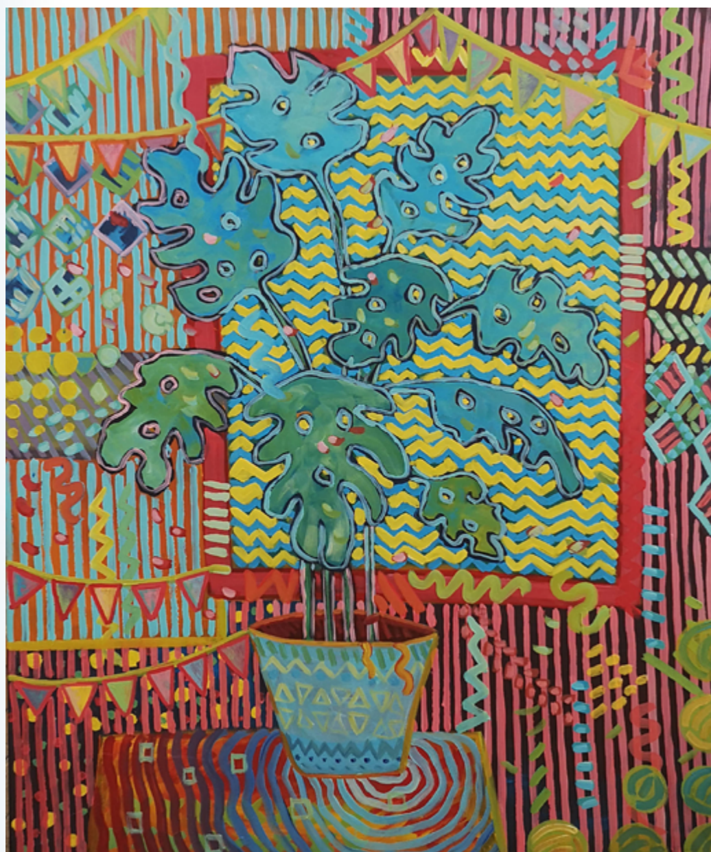
Monstera akryl na płótnie 120 x 100 cm 2022