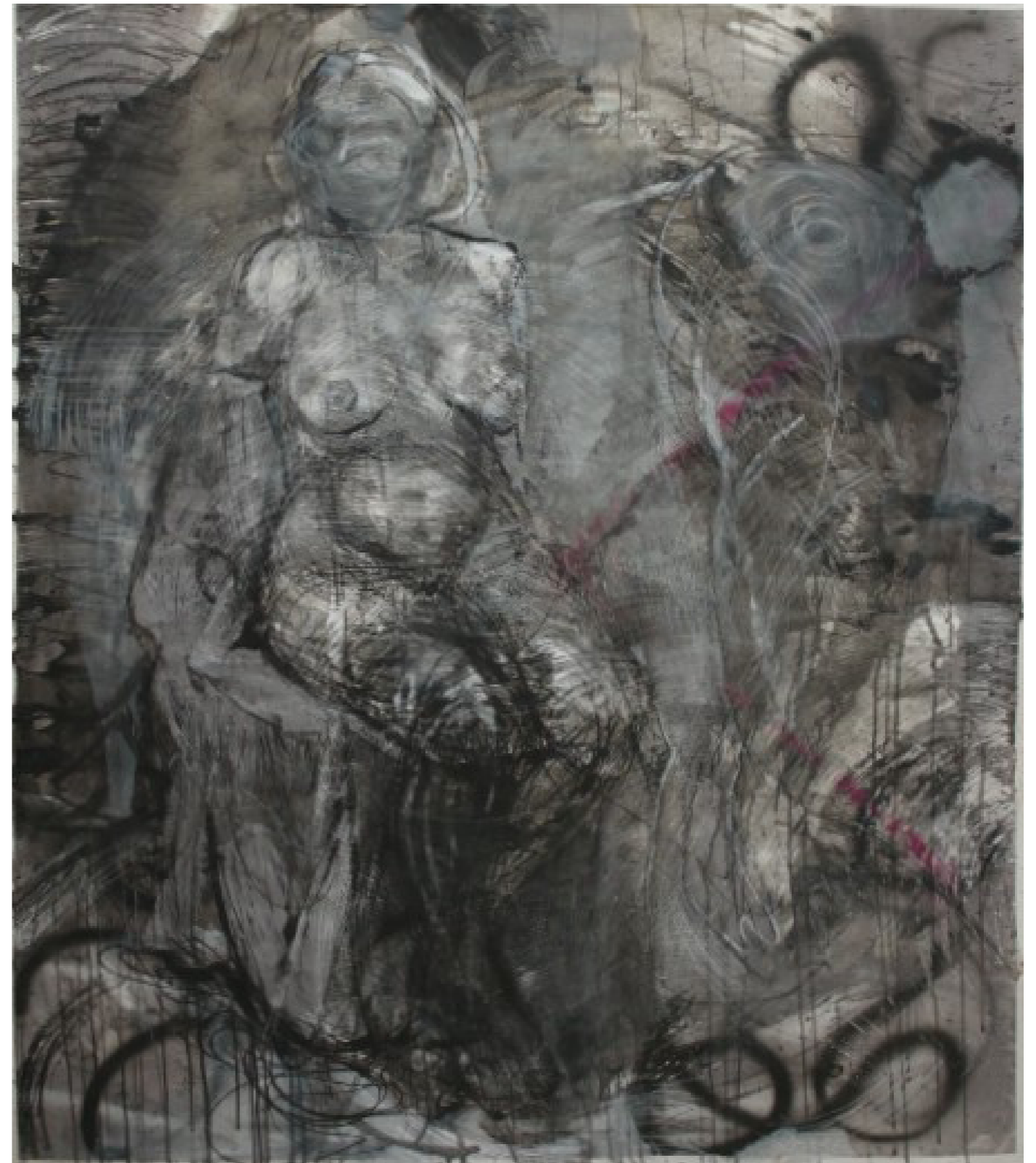
Na celowniku akryl/ spray/ węgiel 126 x 146 cm 2022