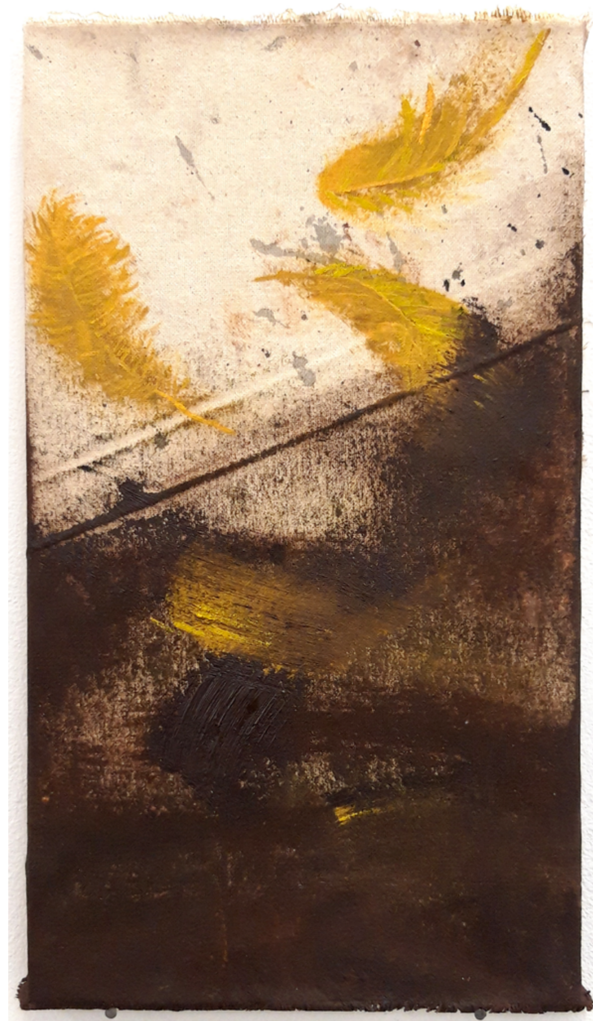
Nowa warstwa olej na płótnie 20 x 35 cm 2021