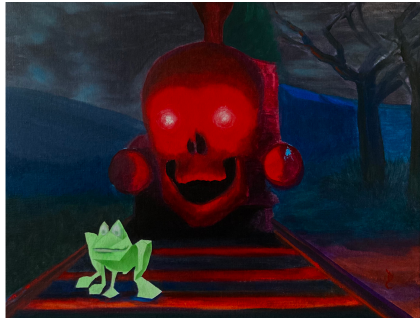
High speed metal akryl i olej na płótnie 50 x 60 cm 2021