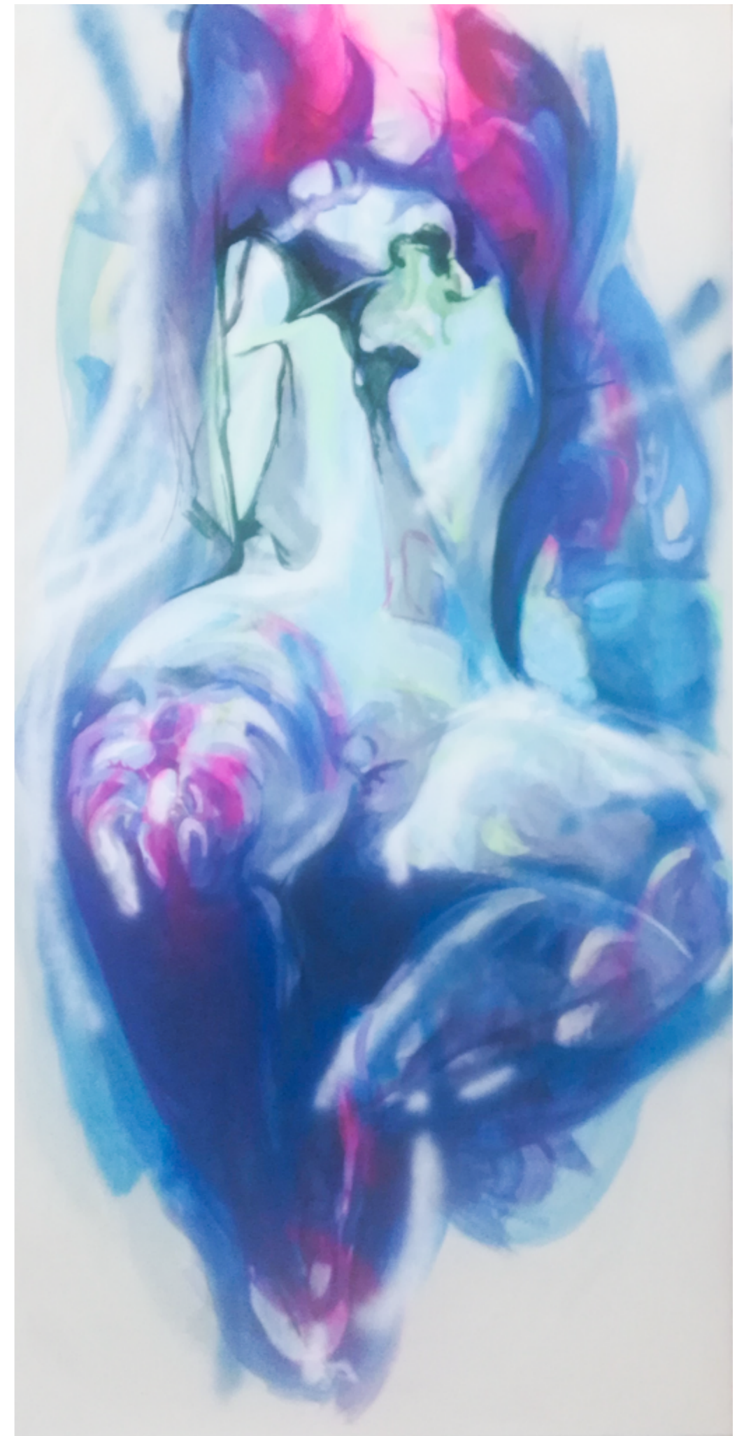
Bez Tytułu technia mieszana 200x100 cm rok