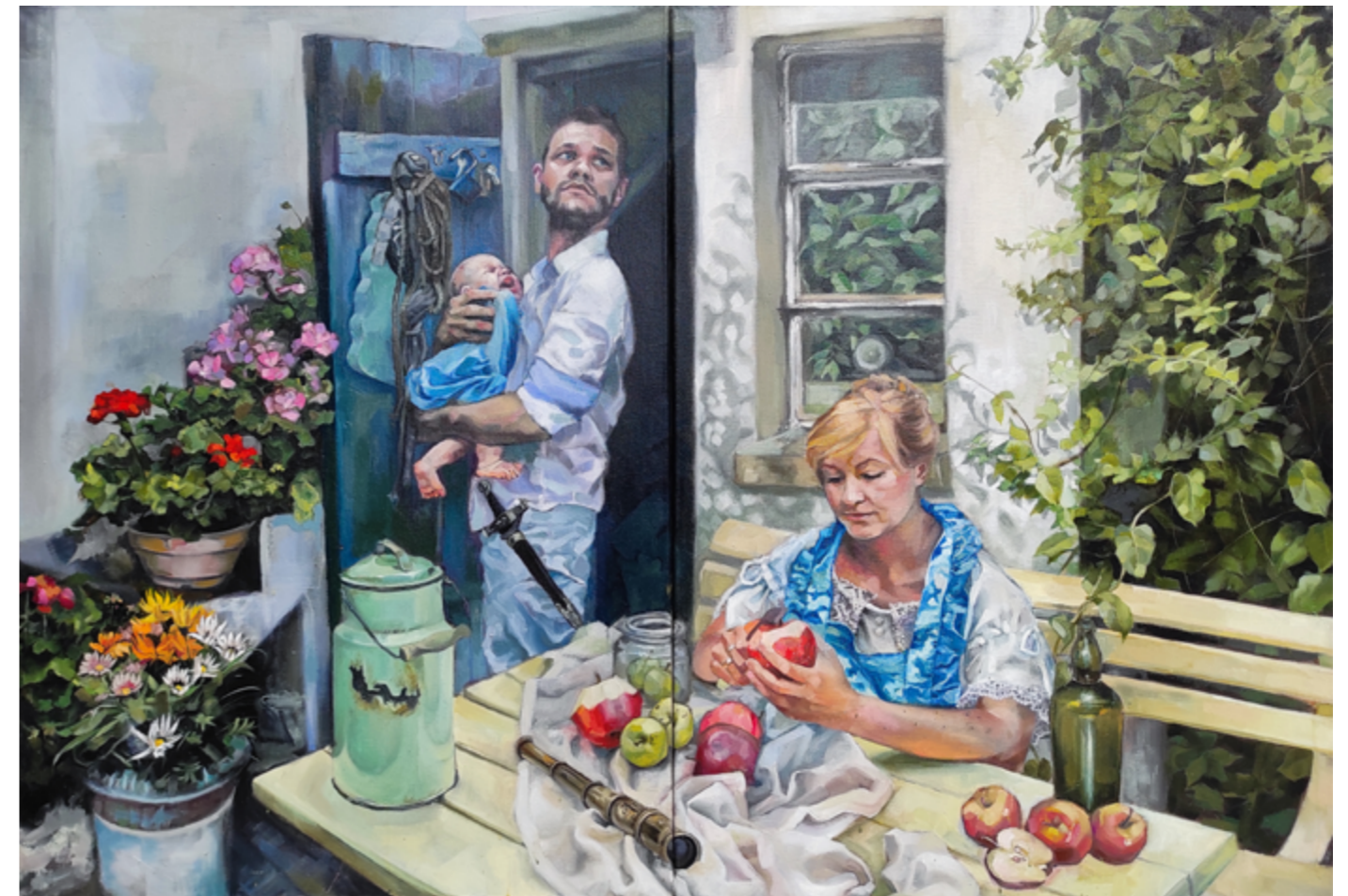
Flauta olej na płótnie 110 x 140 cm 2021