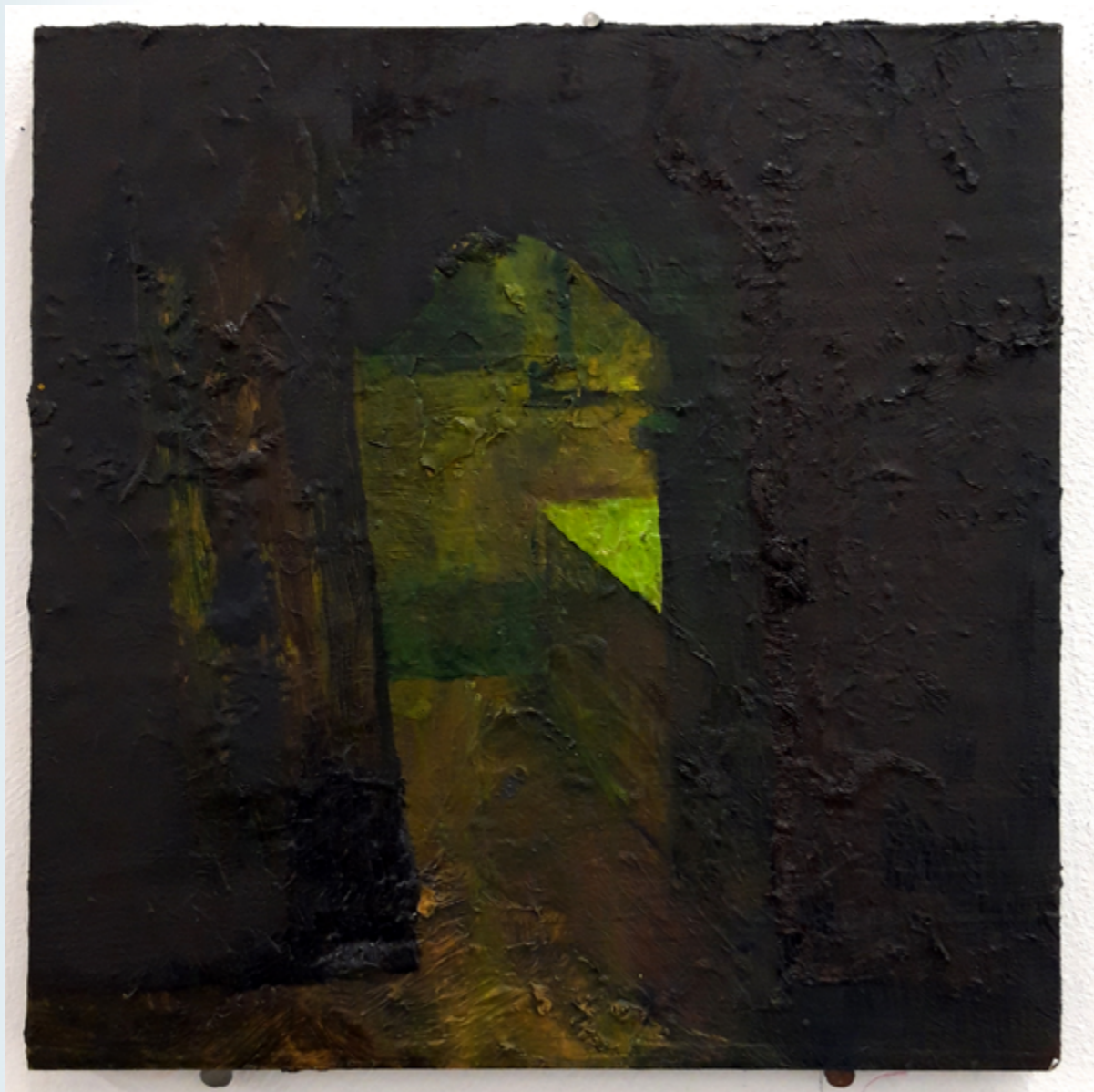
Bez tytułu olej na desce 20 x 30 cm 2021