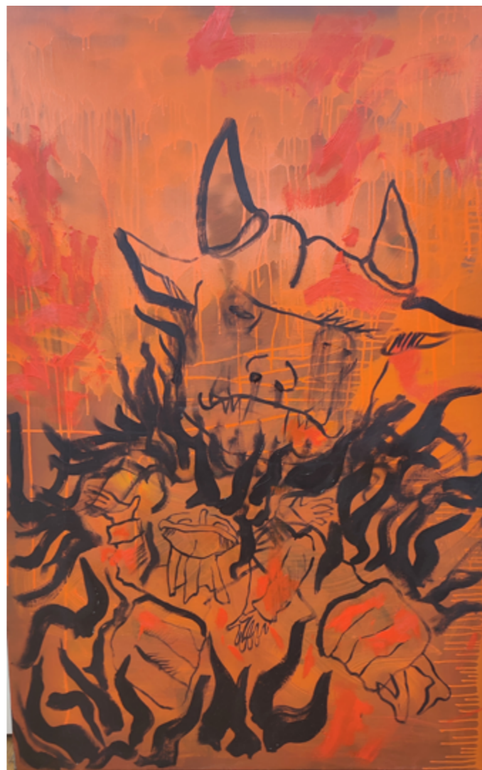
Król technika mieszana 100 x 150 cm 2021/22