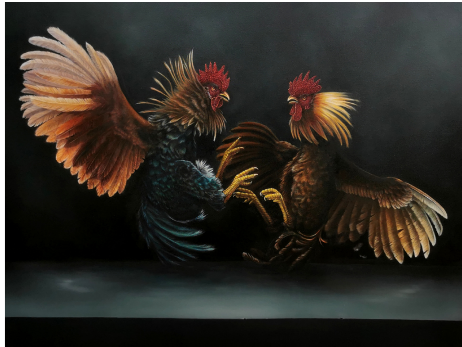
Walka Kogutów olej na płótnie 90 x 120 cm 2022