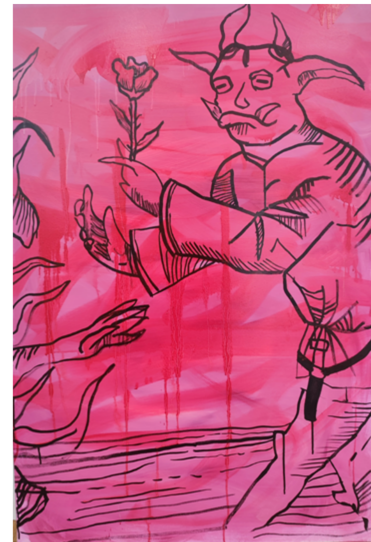
Głupiec technika mieszana 100 x 130 cm 2021/22