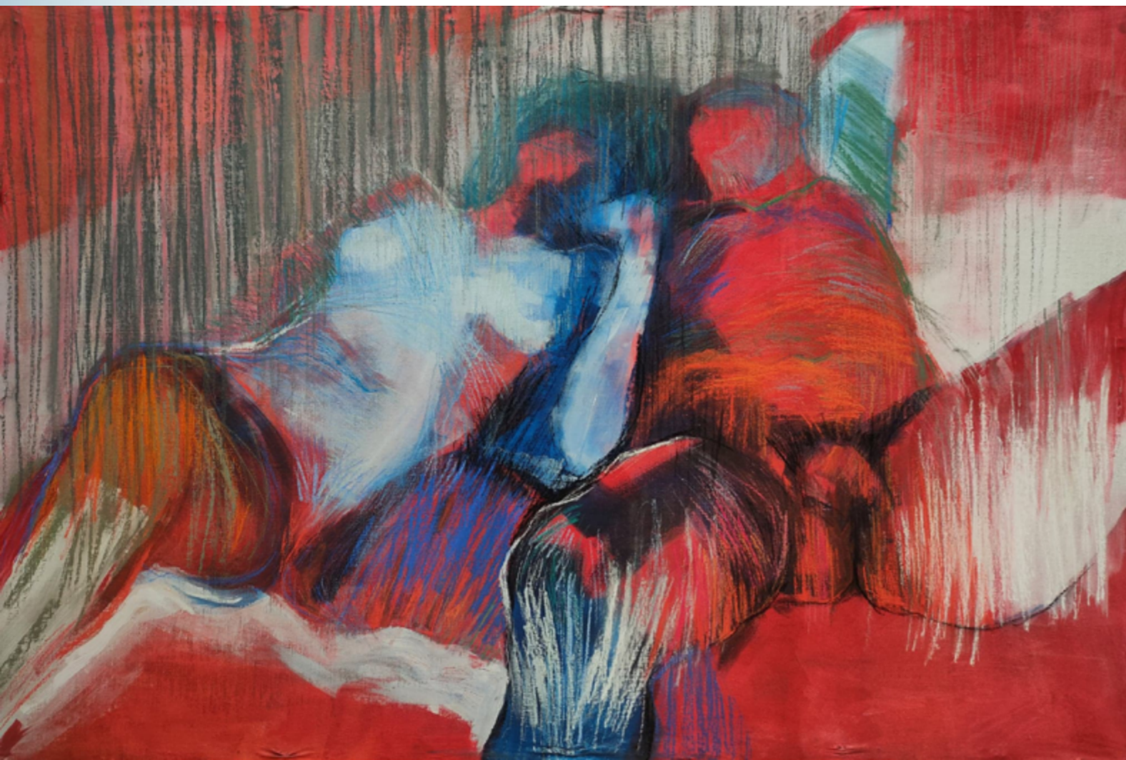
bez tytułu akryl i suche pastele płótno na desce 150 x 100 cm 2022