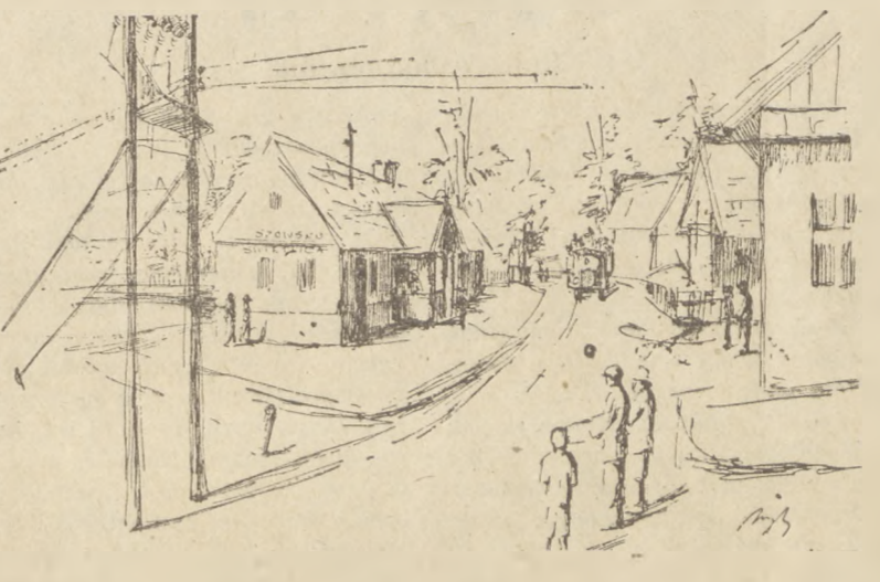
Rys. J. Nykiel.

*) Wiadomość o tym znajdujemy w lubelskich księgach sądowych.