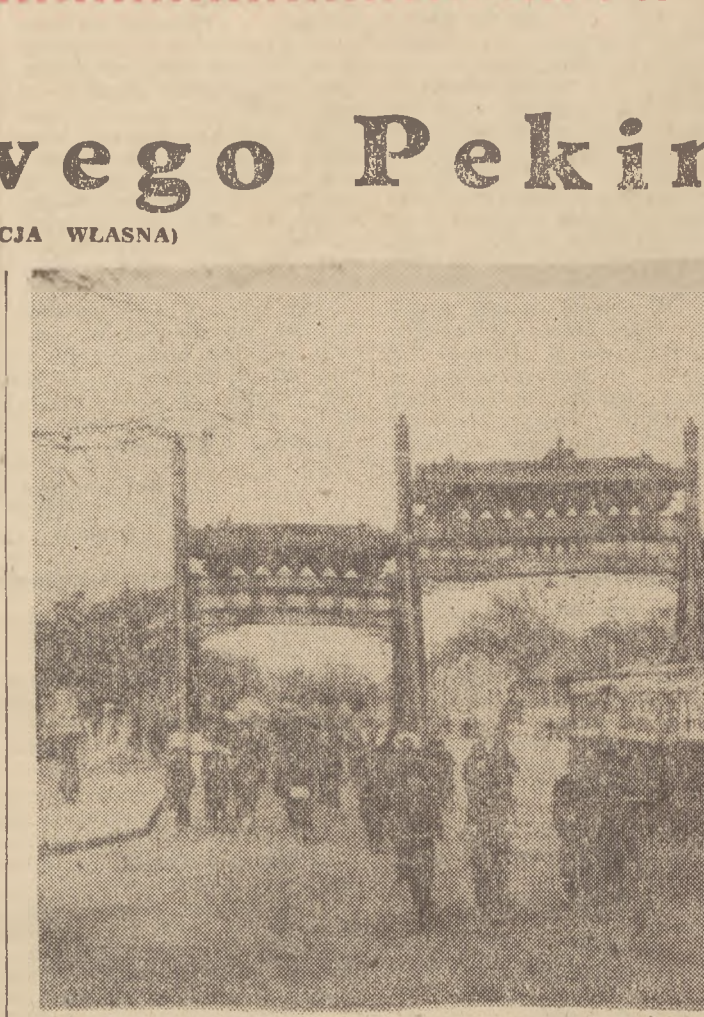
Ludzi na rowerach tyle chyba, co w przysiółkowej Danli.