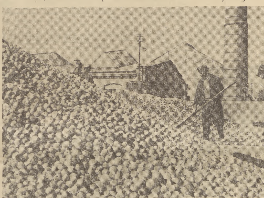
Zakładami ściśle związanymi z rozwojem ogrodnictwa i sadownictwa w Polsce, są zakłady przerobstwa owocowo-warzywnego. Jedne z większych zakładów tego typu, to Milejowskie Zakłady Przerobstwa Owocowo-Warzywnego koło Lublina. Produkują one wino owocowe, marmolady, kompoty, soki, koncentraty itp. przetwory.

Na zdjęciu: zgarnianie jabłek do transportera.