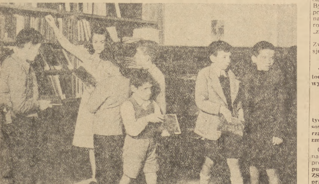
Przed wojną Albania posiadała 1 bibliotekę państwową i 4 prywatne. A dziś otwartych jest 11 dobrze wyposażonych bibliotek, 4 muzea i 342 czytelnie, cieszące się olbrzymim powodzeniem.