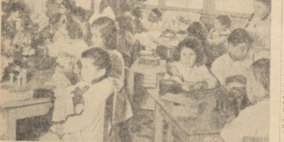
Największą troską i opieką władzy ludowej otoczeni są najmłodsi obywatele kraju. Na zdjęciu: dzieci w jednym z przedszkoli.

W Albanii, która jeszcze przed 9 laty była krajem jednym z najbardziej zacofanych w Europie (90 proc. mieszkańców nie umiało czytać ani pisać), następują szybko wielkie przemiany.