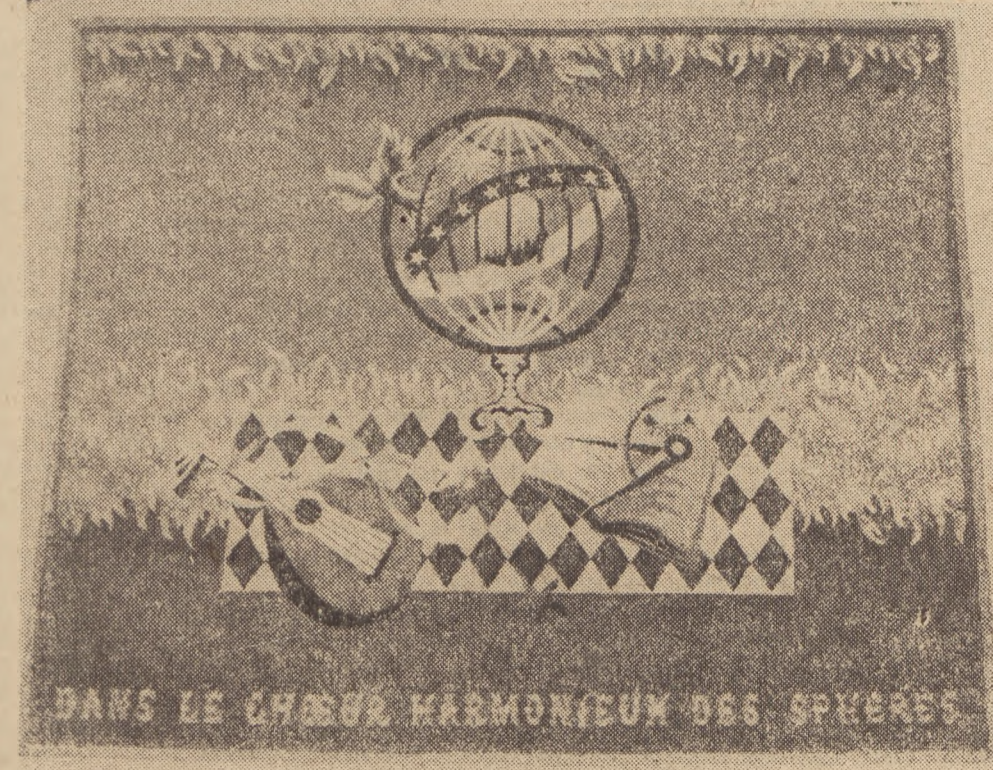
Jean Picart-le-Doux: „Hoid Koperakowit”.

Wystawa, mieszcząca się w gmachu Zachęty w Warszawie, cieszy się dotychczas dużym zainteresowaniem — daje ona obraz oryginalnej, ludowej francuskiej twórczości artystycznej. Wystawa jest dalszym krokiem na drodze zblizenia kulturalnego i zacienienia więzów przyjaźni, łączących oba narody.