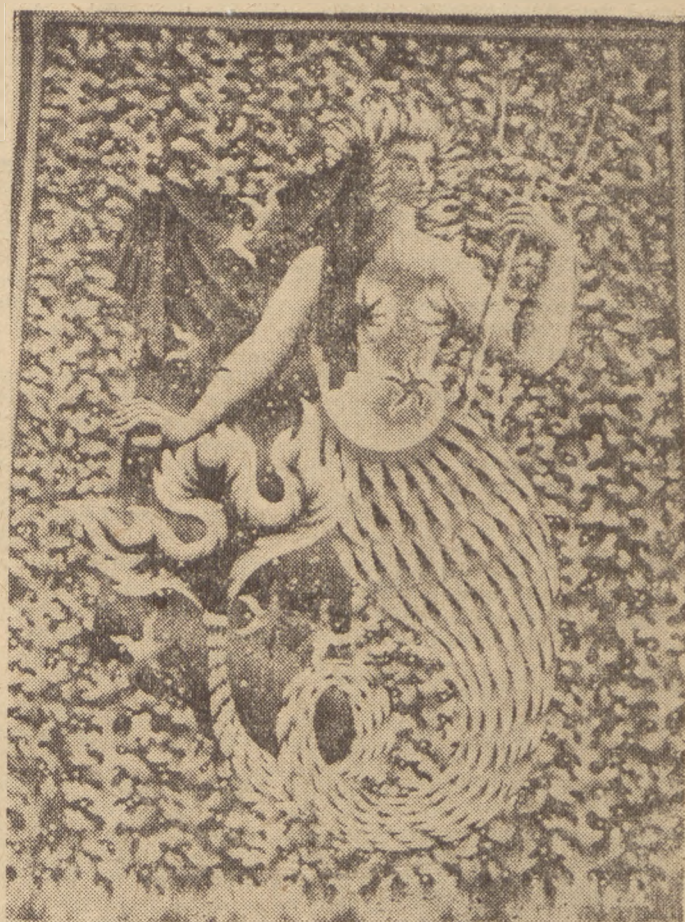
Jean Picart-le-Doux: „Sirena”.