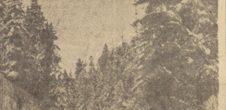
Przyjemnie jest na zimowych wczasach pracowniczych...