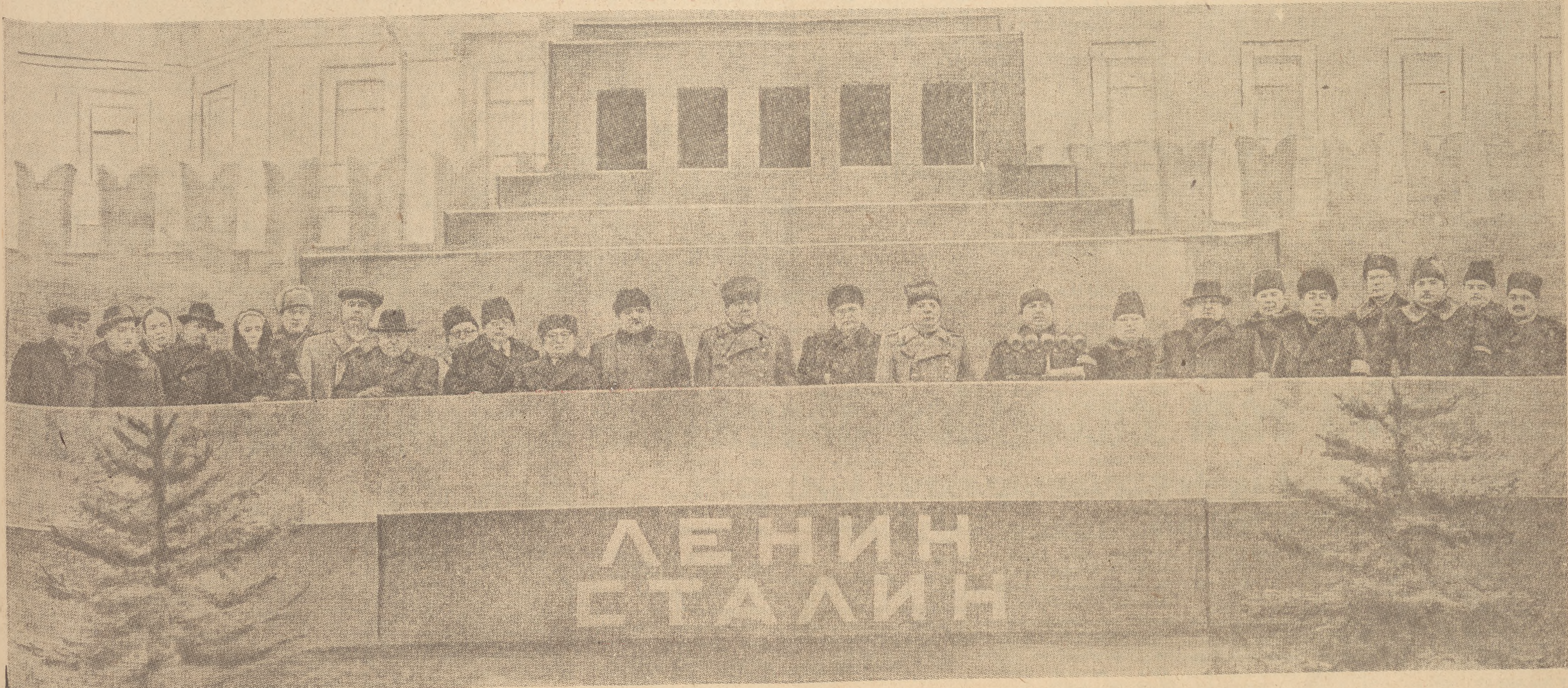
Pogrzeb Józefa Stalina. Na trybunie Mauzoleum towarzysze (od lewej): Gheorghiu Dej, Bolesław Bierut, Pak Den-Ai, Walter Ulbricht, Dolores Ibarruri, Otto Grotewohl, Włkło Czerwenkowi, Matyas Rakosi, Pietro Nenni, Palmiro Togliatti, Jaques Duclos, Klement Gottwald, N. A. Bulganin, W. M. Molotow, K. E. Woroszyłow, G. M. Malenkow, N. S. Chruszczow, L. P. Beria, M. Z. Saburow, Czou En-lai, M. G. Pieruchin, Z. M. Kaganowicz, N. M. Szernik, A. I. Mikoja.