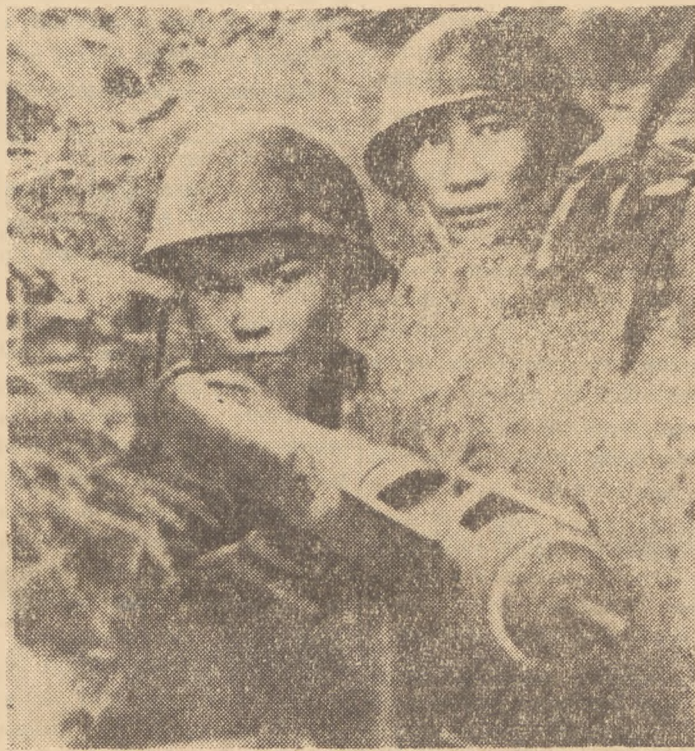
Młodzież w krajach kolonialnych jest okrutnie wyzyskiwana, prześladowana przez imperialistyczne władze kolonialne.

Na zdjęciu: słuchacze Politechniki Warszawskiej.