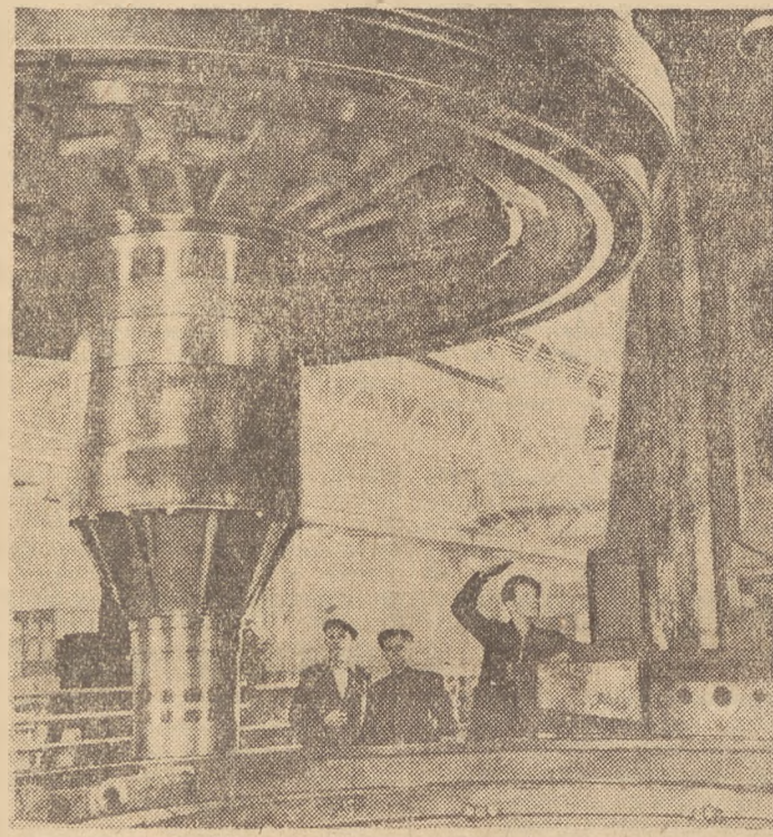
Młodzież Związku Radzieckiego i krajów demokracji ludowej bierze olbrzymi udział w wielkim socjalistycznym budownictwie pokojowym. Tworząc szczęśliwe i jasne życie — swą pracą umacniają pokój i przyjaźń między młodzieżą świata walczącą o ludzkie prawo do życia i pokoju.

Na zdjęciu: o młodzi Vietnamczycy, którzy z bronią w ręku walczą o całkowite uniezależnienie swego kraju od imperialistów.