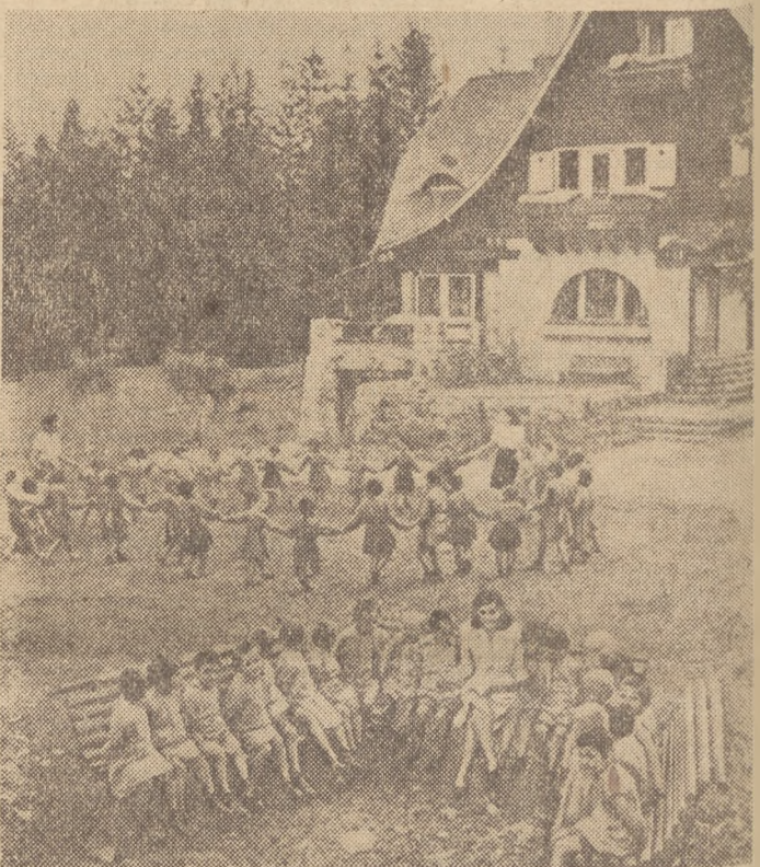
W krajach obozu pokoju i socjalizmu rośnie zdrowe młode pokolenie — duma i radość wolnych narodów.

Na zdjęciu: młodzi robotnicy radzieccy przy produkcji turbiny dla wielkiej elektrowni wodnej — budowlę komunizmu.