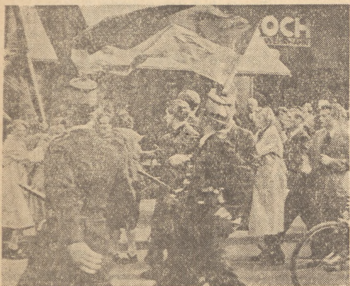
800 tysięcy młodych robotników w Niemczech zachodnich pozbawionych jest pracy. Położenie młodzieży krajów kapitalistycznych pogarsza się z każdym dniem. Przyczyną tego położenia są wydatki wojenne stanowiące jeden z objawów agresywnej polityki amerykańskich imperialistów.

Stany Zjednoczone wydają np. 74 procent budżetu na zbrojenia, a tylko ok. 1 proc. na cele socjalne powiększając coraz bardziej mas ludowych swego kraju. Posiuzone mowadawcom z USA antyludowe rządy krajów kapitalistycznych idą tą samą drogą.