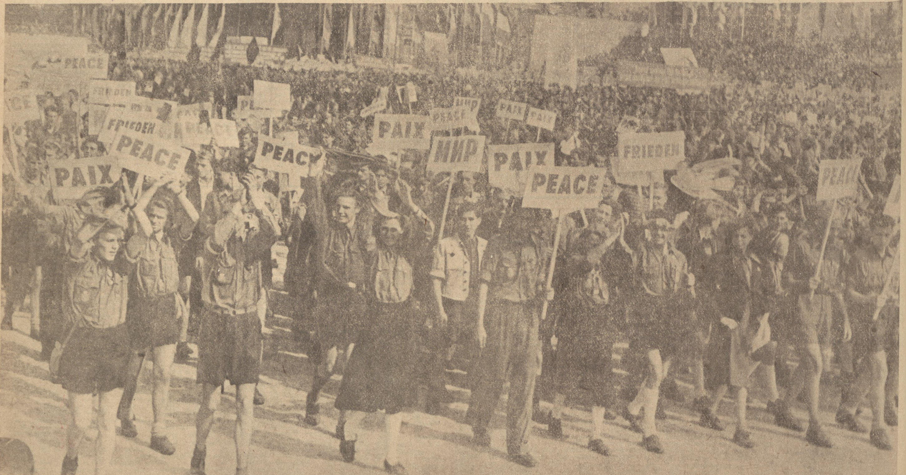
Potężną manifestacją jedności młodzieży świata w walce o pokój i swe prawa był III Światowy Zlot Młodych Bojowników o Pokój w Berlinie.

Na zdjęciu: Dom Wypoczynkowy dla dzieci i młodzieży rumuńskiej w Timis-Tabes.