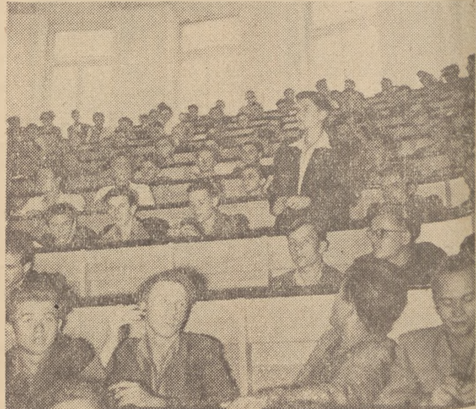
Młodzież Związku Radzieckiego i krajów demokracji ludowej otoczona jest szczególną opieką państwa.

Stachanowiec z Uralsu, bijący rekordy wytopów stał i budowniczy Nowej Hut, wznoszący mury kombinatu, patriota niemiecki, walczący przeciwko układowi ogólnemu i bojownik francuski, żądający zaprzestania „brudnej wojny” w Vietnamie — to ogólna tego samego łańcucha, łańcucha ogólno-swiatowego frontu walki o pokój, walki, która jest fundamentem lepszej i szczęśliwszej przyszłości młodego pokolenia wszystkich kontynentów.