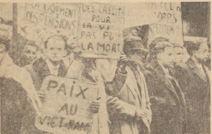
Młodzież francuska odpowiada na ataki Imperialistów amerykańskich i ich najimów przeciwko pokojowi, nauce i kulturze narodowej wzmocniona akcją protestacyjną wzmocnionym oporem przeciwko programowi zbrojeń.

Na zdjęciu: młodzi górnicy sycylijscy kopalni siarki na Sycylii.