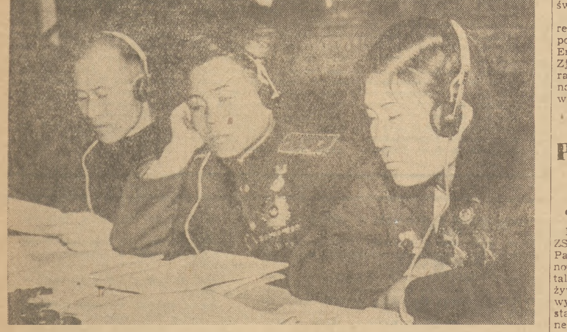
Przedstawiciele bohaterkiej młodzieży koreańskiej na sali obrad.