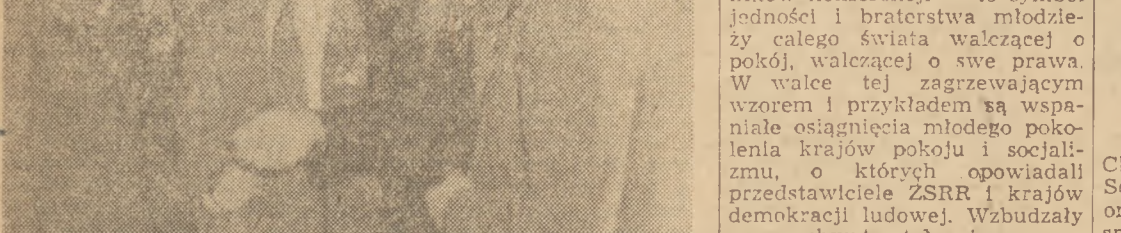
Członkowie polskiej delegacji podczas spotkania z młodzieżą angielską.

państw kapitalistycznych, na rozkaz centrali reakcji światowej — USA. Dlatego też młodzież za główny swój obowiązek uważa walkę przeciwko wojnie o pokój i przyjaźni między narodami, widząc w tym drogę zabezpieczenia swych podstawowych praw. Mimo różne wstępoglądów, rasowych czy narodowościowych, uczestników konferencji łączący uczucia bratniej jedności i solidarności w walce o wspólny cel — o pokój, o prawa młodzieży. Niejednokrotnie sala konferencyjna była miejscem gorących manifestacji przyjaźni i braterstwa. Do porozumienia się zbyteczna była znajomość języków — zastępowały ją uśmiech, braterski uścisk dłoni, wiązanka kwiatów. Jedno z braterstwo uczestników konferencji — to symbol jedności i braterstwa młodzieży całego świata walczącej o pokój, walczącej o swe prawa. W walce tej zagzewajającym wzorem i przykładem są wspaniałe osiągnięcia młodego pokolenia krajów pokoju i socjalizmu, o których opowiadali przedstawiciele ZSRR i krajów demokracji ludowej. Wzbudzały one zachwyt, stały się nowym bodźcem do dalszej, jeszcze energiczniejszej walki o pokój i przyjaźni między narodami.