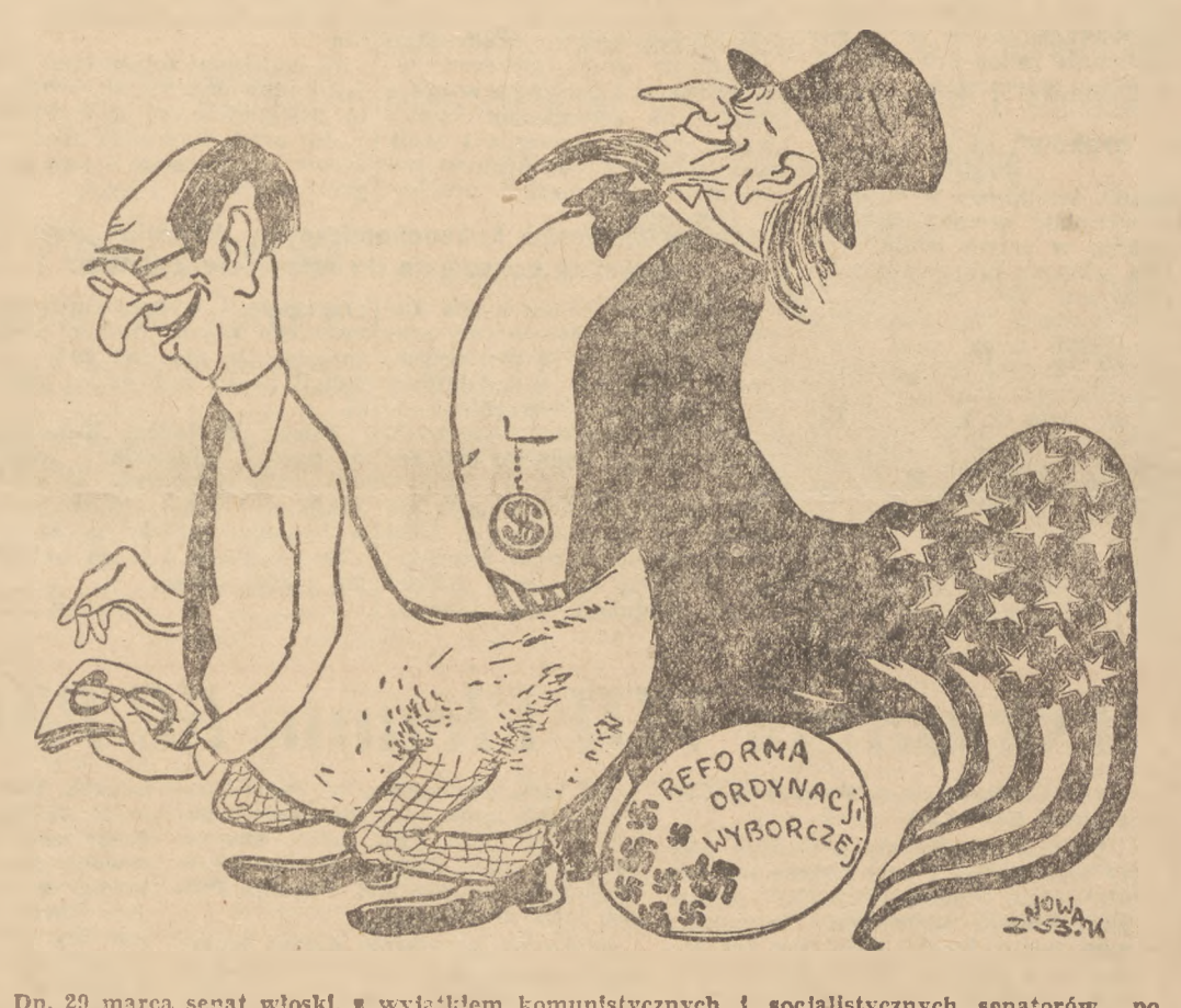
Dn. 29 marca senat włoski, z wyjątkiem komunistycznych i socjalistycznych senatorów, po porażeniu, które trwało 77 godzin bez przerw i zakończyło się burzliwym zajęciami, zatwierdził rządowy projekt ustawy o faszystowskiej reformie ordynacji wyborczej. Rys. Z. Nowak