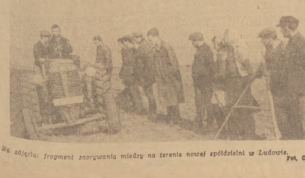
Na zdjęciu: fragment zaorywania miedzy na terenie nowej spółdzielni w Ludowie.

I bm. rozpoczęło się w Pałacu Młodzieży im. Bolesława Bieruta w Stalingradzie III publiczne losowanie obligacji Narodowej Pożyczki Rozwoju Sił Polskiej.