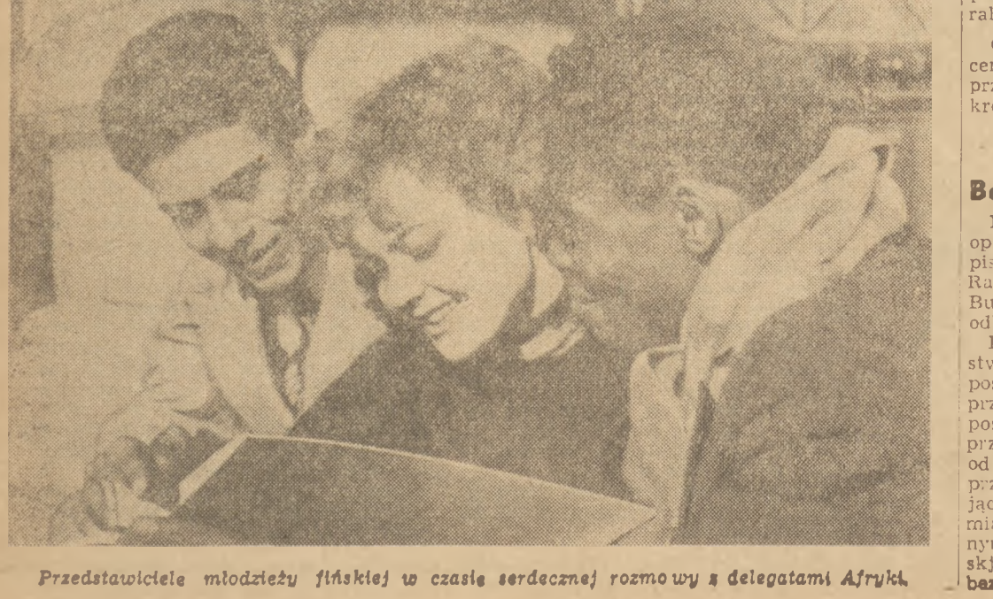
Przedstawiciele młodzieży fińskiej w czasie serdecznej rozmowy z delegatami Afryki.