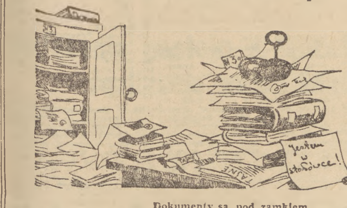
Dokumenty są pod zamkiem... (rys. z „Krokodyla”)

Był luty. Za oknami Zarządu Powiatowego ZMP w Brzozowie, woj. rzeszowski — dął zimny, porażający wiatr. Przewodni zarys Z.P. spoglądał się nad gazetą. „Sprawia też tymczasem 608325, czyli lekcia czu- łostwa”. „Oho! Jest coś na czasie — powiedział do siebie i zapisał się w studiu- umianiu artykułu „Sztandaru Młodych”. Okazało się, że artykuł jest rzeczywiście bardzo na czasie, bo z artyku- łem w owym brzożowskim nie jest zbyt dobrze.