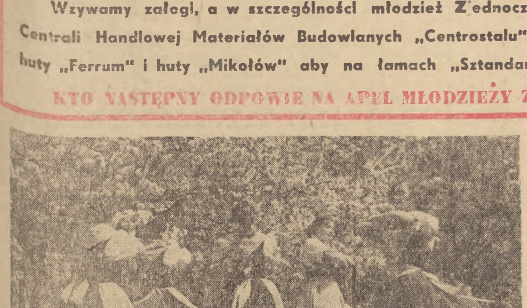
Zespół taneczny Technikum Ogrodnictwa w Prószkowie, woj. opolskie.

W Monitorze Polskim z dnia 7 bm. ukazała się Uchwała Prezydium Rządu w sprawie wykorzystania i planowej rozbudowy urządzeń sportowych... Uchwała przewiduje dalsze zwiększenie ilości obiektów sportowych i rozwój kultury fizycznej i sportu.