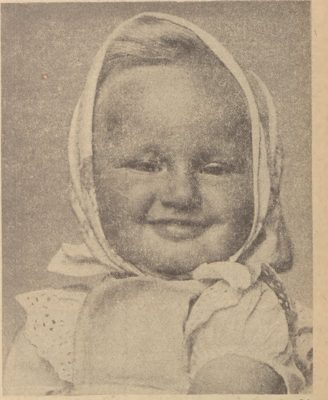
Informację o przebiegu uroczystości i imprez w przeddzień Międzynarodowego Dnia Dziecka zamieszczamy na str. 2.

Przyjaźni młodzieży całego świata nowymi zwycięstwami na polu produkcji i nauki, nowymi osiągnięciami w rozwoju twórczości amatorskiej i życia świeckiego. Zadaniem całej młodzieży polskiej jest także powitać Festiwal nowymi jeszcze wspanialszymi sukcesami w dziedzinie sportu i kultury fizycznej. Naszym zawołaniem jest: „Młodzieży! Sportowy miast i wsi! Wszyscy na stadion, boiska i pływalnie”. Zdobywajmy odznaki SPO, bójmy rekordy, pomnażajmy nasze osiągnięcia sportowe!