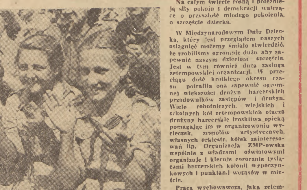
Praca wychowawcza, jaką zetemposcy prowadzą w drużynach harcerskich, pomaga harcerzom wyrastać na dobrych uczniów, przyszłych zetemposów.

Praca ta zajmuje poważne miejsce w życiu ZMP. Zadania ZMP w dziedzinie wychowania dzieci stały się coraz ważniejsze. Potrzebny jest coraz więcej wysiłku ZMP dla polepszenia i pogłębienia tej pracy.