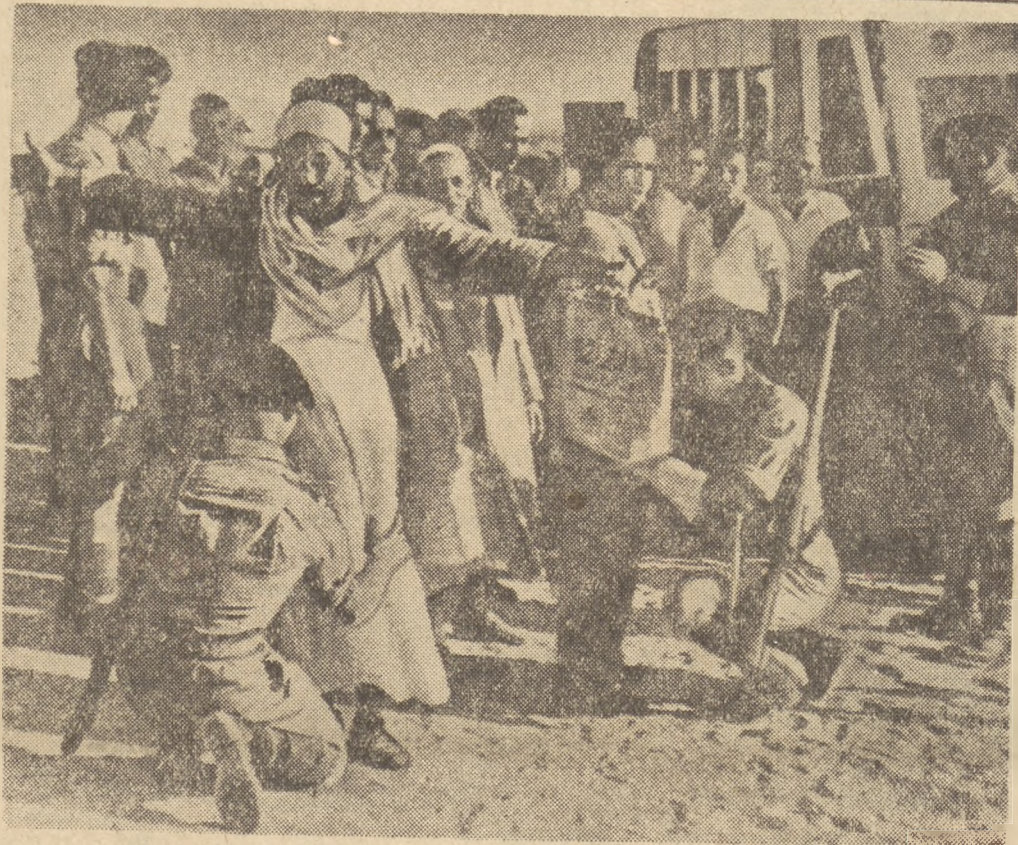
Angielskie wojska zaprowadziły w Egipcie ostry rygor wojskowy. Na zdjęciu: żołnierze wojsk brytyjskich w Egipcie dokonują rewidji w strefie Kanalu Sueskiego.