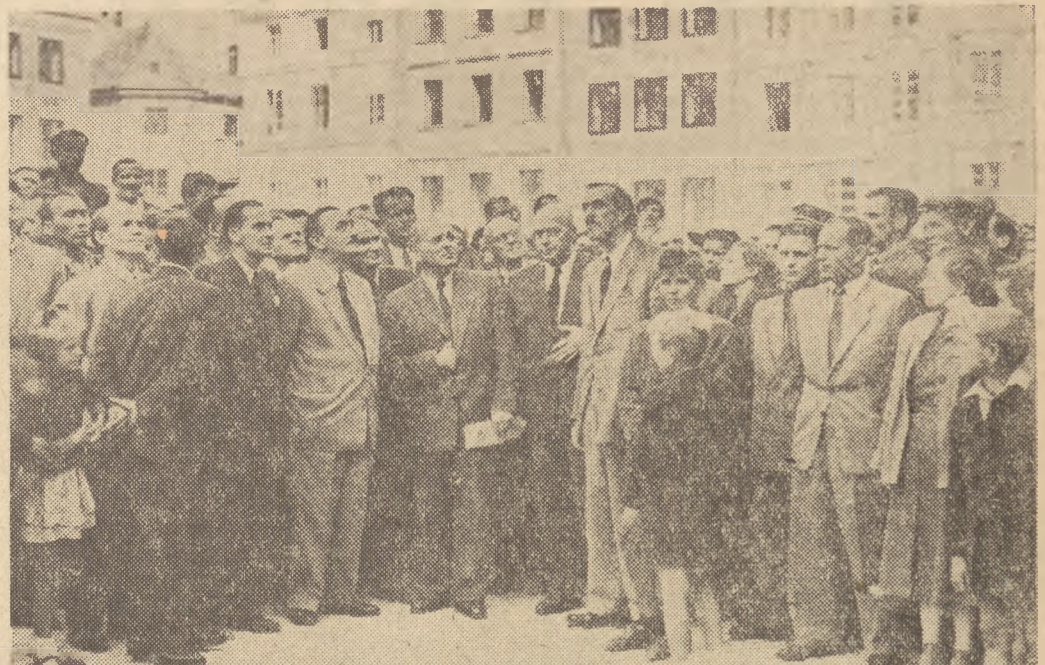
16 lipca budowniczy Traktu Starej Warszawy gościli Prezesa Rady Ministrów Bolesława Bieruta.