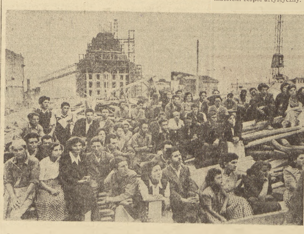
Pierwsze zebranie młodych budowniczych Sofii, na którym postanowili oni wzmocnić przyjaźń i jedność młodzieży.

Światowy Festiwal Młodzieży i Studentów w Bukareszcie będzie wspaniałym pokazem sztuki narodów. Już przeszło 70 krajów wyraziło pragnienie wzięcia udziału w programie kulturalnym Festiwalu. W teatrach, kinach i na estradach zbudowanych na placach miejskich odbędą się setki występów artystycznych. Setki tysięcy ludzi będą codziennie przyglądały się tym występom. Delegaci na Festiwal poznają m. in. chór „Orfeon Martiano” z Bayamo na Kubie, chór z Gdanskia, wykonawców tańca z mieczami z Anglii, zespół chóralny pionierów bułgarskich, zespół „Ad Dozai” z Algeru, balet leningradzki, mistrzów cyrku chińskiego i wiele innych zespołów artystycznych. Do sukcesu Festiwalu przyczynią się wybitni artyści, którzy przyjadą do Bukaresztu, aby swą sztuką i talentem wnieść wkład w dzieło umocnienia przyjaźni młodzieży świata. Na Festiwalu wystąpi fińska orkiestra symfoniczna, chór bukareszteskich zakładów pracy złożony z 2 tysięcy osób, zespół japoński, chór z Chile, zespół studencki z wyspy Martiniki itd. Podczas Festiwalu wyświetlone zostaną najlepsze filmy świata.