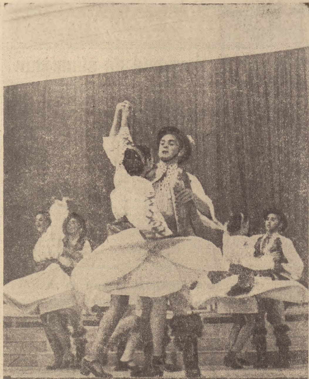
Występ rumuńskiego zespołu ludowego