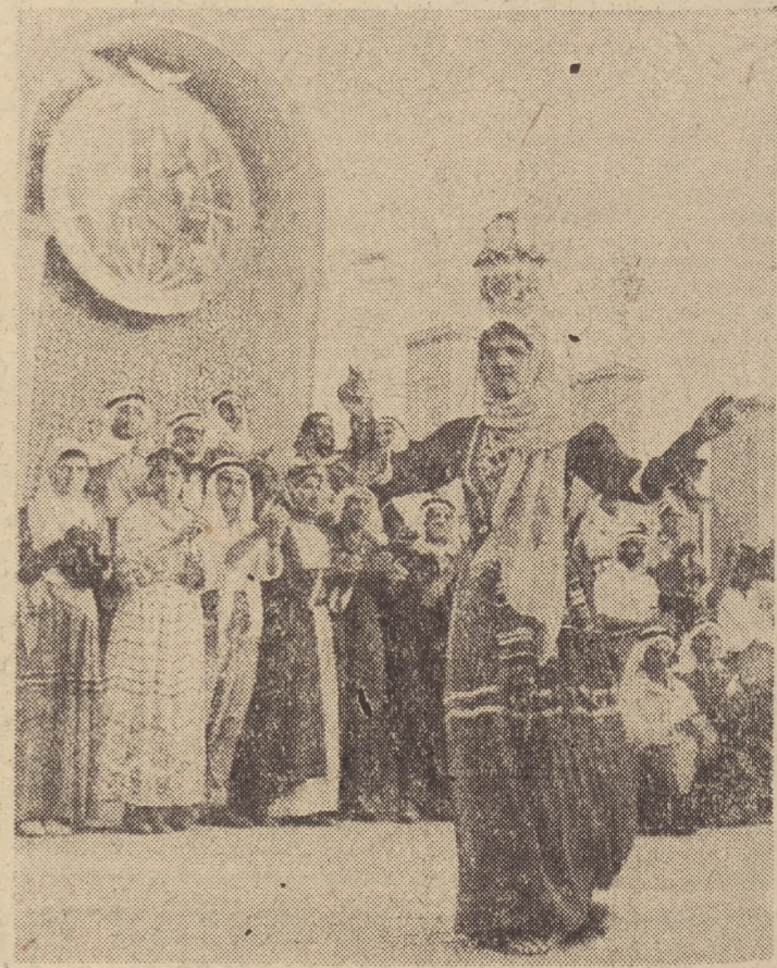
Niemalże trzeba zręczności, żeby tańczyć tak, jak to uśmiechnięta dziewczyna z amatorskiego zespołu tanecznego Syrii i Libanu