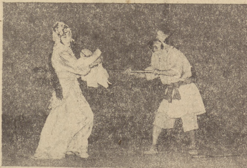
Występ chińskiego zespołu tanecznego