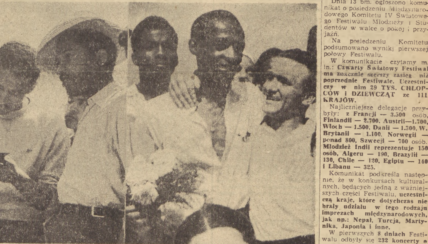
Bukareszt. Podczas spotkań, zabawa i manifestacji, w rozmowach i dyskusjach, poprzez wymianę autografów i upominków delegaci z różnych stron świata zacieśniają przyjaźń z młodzieżą krajów kolonialnych i zależnych

Cztery razy więcej przeznacza się pieniędzy na policję niż na szkolnictwo; robotnicy rolni za codzienny zarobek mogą kupić trzy kg chleba — to Alger. W czasie jednej z demonstracji zabito 28 studentów a ranniono 100 — to Kairach w Pakistanie. 400 tys. obcych żołnierzy i 485 obozów koncentracyjnych — to Malaje. 95 proc. ludności nie umiejącej czytać i pisać — to Patet Lao.