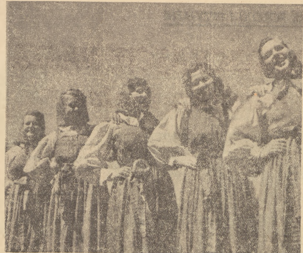
Dziewczęta z zespołu tanecznego przy spółdzielni produkcyjnej Wola Wrońska, pow. Grójec, woj. warszawskie.