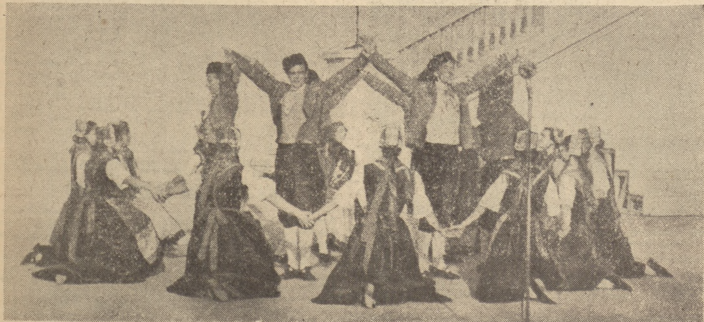
Tańczy zespół pieśni i tańca Niemieckiej Republiki Demokratycznej