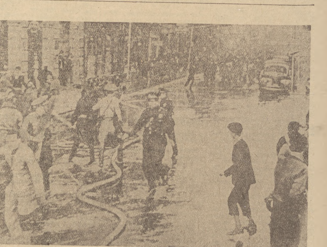
Na dziedzi: demonstracja studentów Meksyku w obronie swych praw, w obronie suwerenności swego narodu, w walce z atakującą policją.