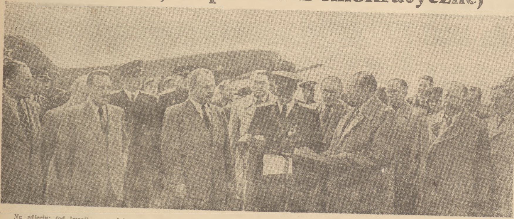
Na zdjęciu (od lewej) przewodniczący Państwowego Komitetu Planowania przy Radzie Ministrów ZSRR M. Z. Saburow, zastępca przewodniczącego Rady Ministrów ZSRR i minister handlu wewnętrznego i zagranicznego ZSRR A. I. Mikojan, pierwszy zastępca przewodniczącego Rady Ministrów ZSRR i premier i minister finansów NRD dr H. Loch, wicepremier i minister przemysłu hutniczego i górnictwa NRD F. Selbmann, premier NRD — O. Grotewohl, wicepremier i minister budownictwa NRD dr L. Bolz oraz towarzyszące im osoby na Lotnisku Centralnym w Moskwie.

W dniu 20 sierpnia przybyła do Moskwy na zaproszenie rządu radzieckiego delegacja rządu Niemieckiej Republiki Demokratycznej. Na czele delegacji stoi premier NRD O. Grotewohl, w skład delegacji wchodzi: wicepremier W. Ulbricht, wicepremier O. Nuschke, wicepremier i minister budownictwa dr L. Bolz, wicepremier i minister finansów dr H. Loch, przewodniczący Rady Narodowej Frontu Narodowego Niemiec Demokratycznych prof. dr E. Correns, przewodniczący Państwowej Komisji Planowania B. Leuschner, przewodniczący Wolnych Niemieckich Związków Zawodowych H. Warnke, przewodniczący Centralnej Rady