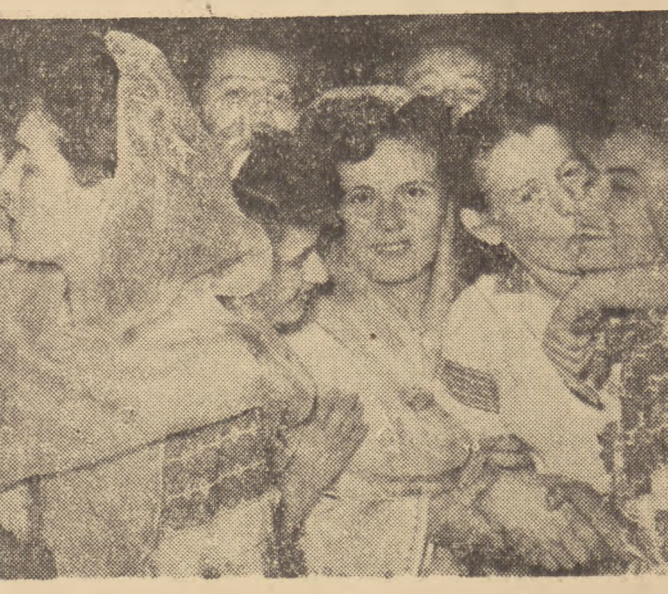
23 sierpnia br. bratni naród rumuński obchodził uroczysto 9 rocznicę wyzwolenia swego kraju spod jarzma hitlerowskich najeźdźców przez bohaterką Armii Radzieckiej.

Wzrosty na 11 zakontraktowanych turek... Wzrosty na 11 zakontraktowanych turek... Wzrosty na 11 zakontraktowanych turek