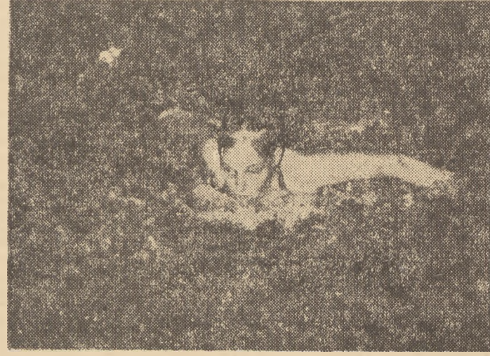
Alicja Kleńska - rekordzistka Polski, na dystansie 100 m st. motylkowym.