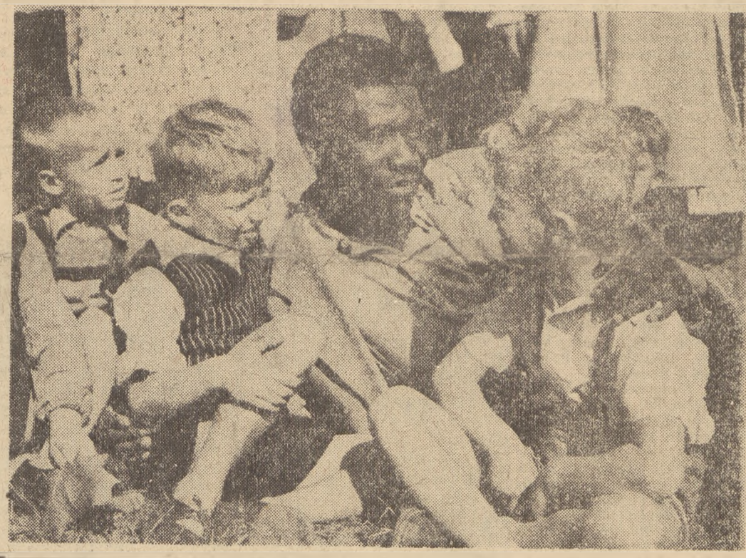
(Sprawozdanie z przebiegu trzeciego i czwartego dnia obrad III Światowego Kongresu Studentów podajemy na str. 2).