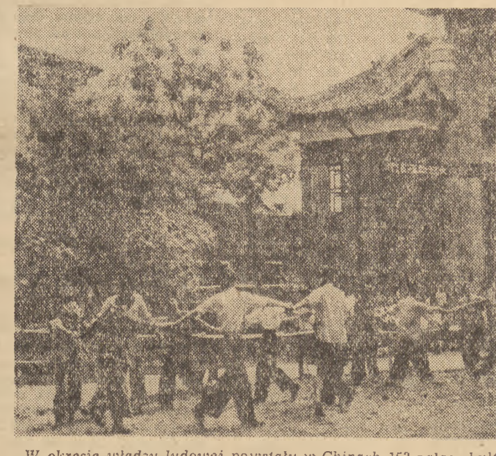
W okresie władzy ludowej powstały w Chinach 152 pałace kultury oraz tysiące świetlic, klubów fabrycznych i zakładowych. Na zdjęciu: robotnicy m. Kweilin w czasie zabawy przed nowowzbudowanym Pałacem Kultury.

W imieniu chłopów, których kłeska dotknęła, delegacja wyraziła podziękowanie władzom radzieckim za pomoc w zwolnieniu ich z wpłacenia kolejnej raty czynszu dzierżawnego oraz z uszczenia zaległości. Delegacja wręczyła Wysokiemu Komisarzowi ZSRR pismo dziękczynne, uchwalone na zebraniu chłopów — drobnych dzierżawców i podpisane przez 70 przedstawicieli chłopów.