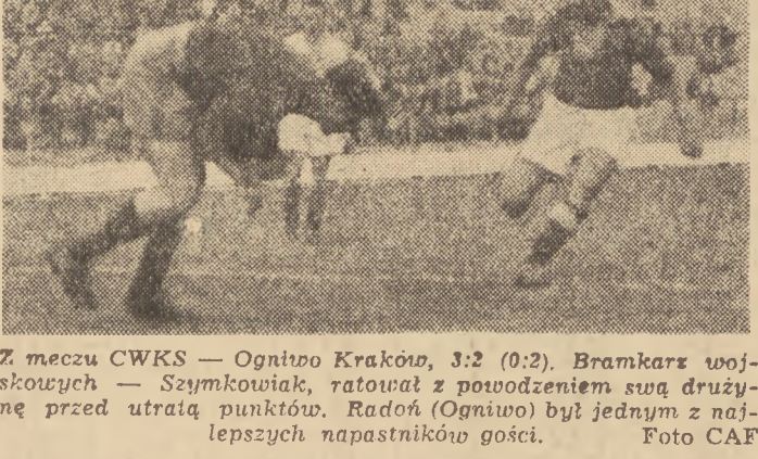
Z meczu CWKS - Ognio Kraków, 3:2 (0:2). Bramkarz wojewódzki...