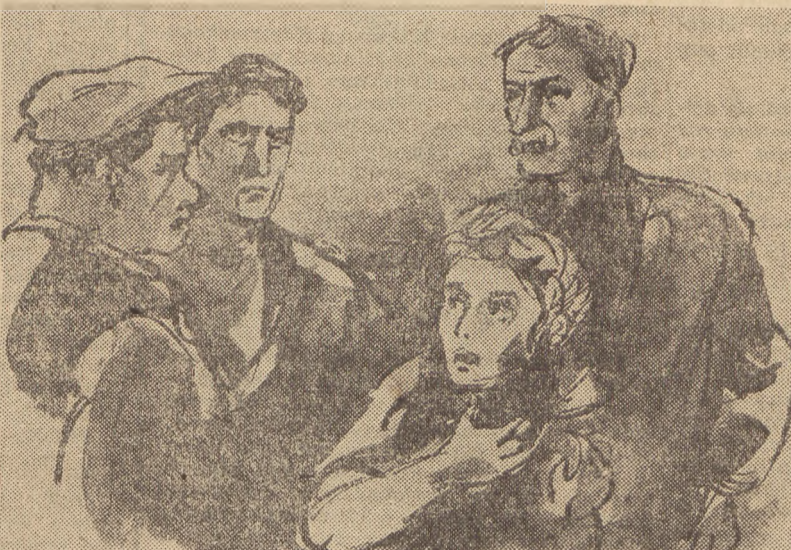
Rys. J. Czwertnia