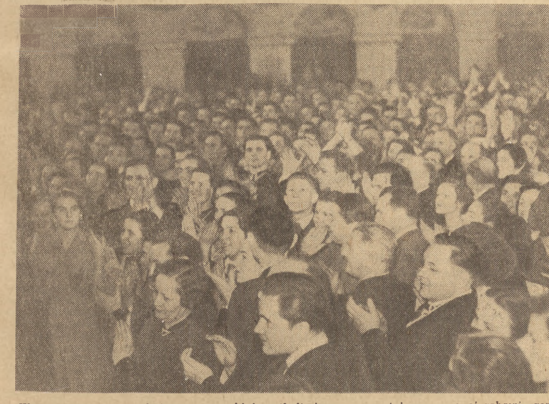
W pięknej auli Politechniki Warszawskiej spotkali się na uroczystej noworocznej zabawie zorganizowanej przez Warszawską Radę Związków Zawodowych — wybitni przodownicy pracy, racjonalizatorzy, przedstawiciele inteligencji pracującej, aktywni członkowie Frontu Narodowego oraz rządu obronności pokoju. Na zdjęciu: Uczestnicy zabawy uświetniają na cześć Nowego Roku 1953.

DOŚĆ W NUMERZE: K. W.: Amerykanin w kraju sojuszników ILJA ERNBURG: Głos bar-dów IGOR NEWERLY: Pisze do Was, Niemceży przyjaciele... (Kartki ze wspomnień)